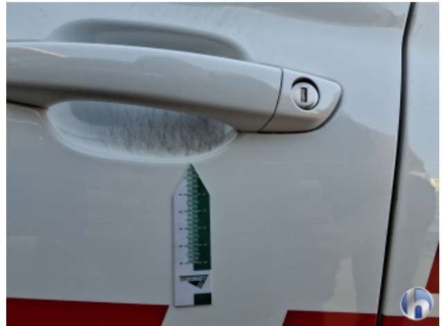
4. Tür Vorne - Links Kratzer - Smart Repair