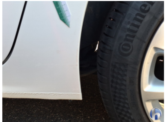
6. Tür Hinten - Links Kratzer - Smart Repair