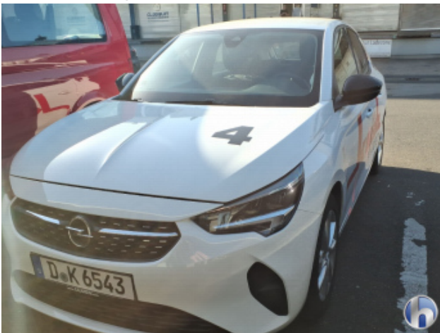
7. FZG Beklebt - Entkleben / Reinigen