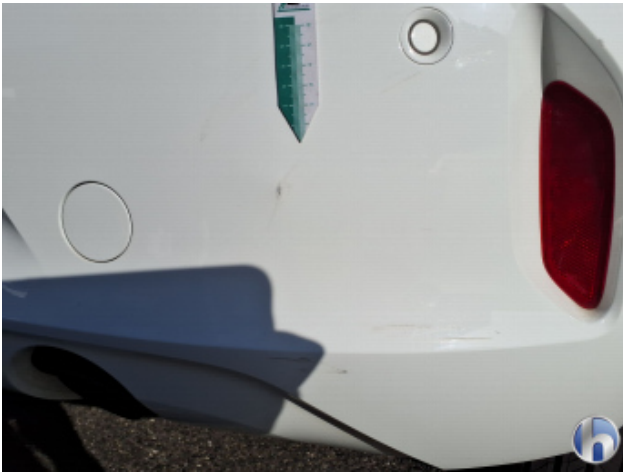
3. Stoßfänger Hinten Kratzer - Smart Repair