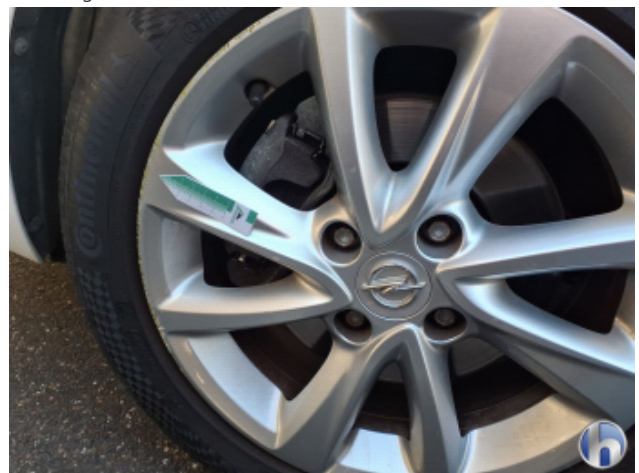
2. Felge Vorne - Links Kratzer - Smart Repair