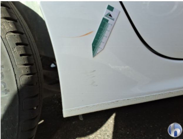
5. Schweller - Rechts Kratzer - Smart Repair