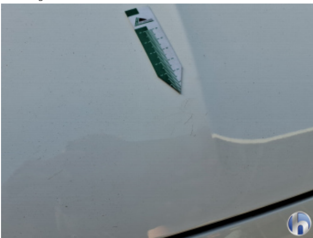
1. Motorhaube Kratzer - Smart Repair