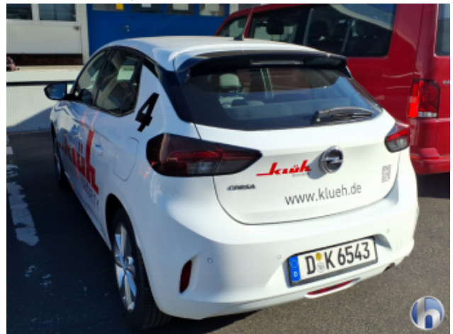
7. FZG Beklebt - Entkleben / Reinigen