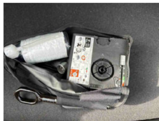
Equipment - Bordwerkzeug