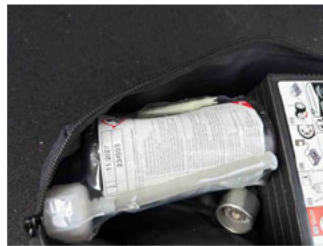
Räder - Haltbarkeitsdatum Tirefit