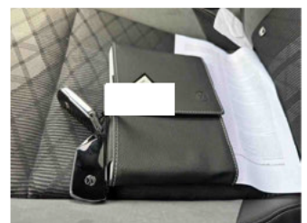
Equipment - Boardmappe/ Securitybag