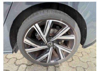
Räder - Rad montiert hinten links