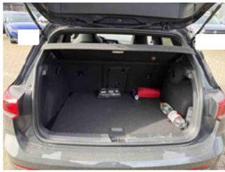
Innenraum - Kofferraum