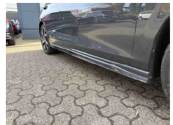
Seitenansicht - Schweller rechts