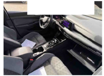
Innenraum - vorne