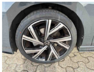
Räder - Rad montiert vorne links