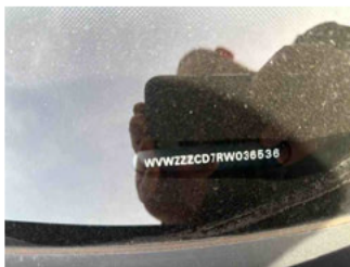
Fahrzeug - Typenschild/Fahrgestellnummer