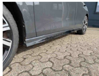
Seitenansicht - Schweller links