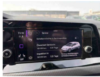
Fahrzeug - Serviceunterlagen / Wartungsnachweis