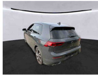
Fahrzeugansicht - diagonal hinten links