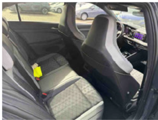
Innenraum - hinten