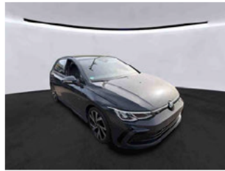
Fahrzeugansicht - diagonal vorne rechts