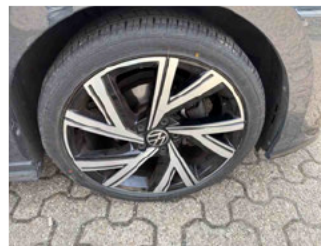
Räder - Rad montiert vorne rechts