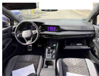
Innenraum - Mittelkonsole