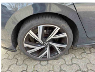
Räder - Rad montiert hinten rechts