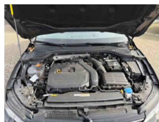
Fahrzeug - Motorraum offen