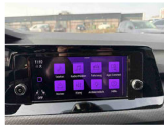
Innenraum - Navigationsgerät/Radio