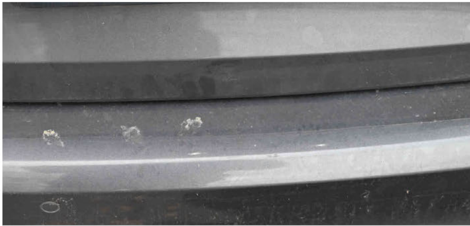
Bild 9 Delle an der Heckklappe unter dem Kennzeichen