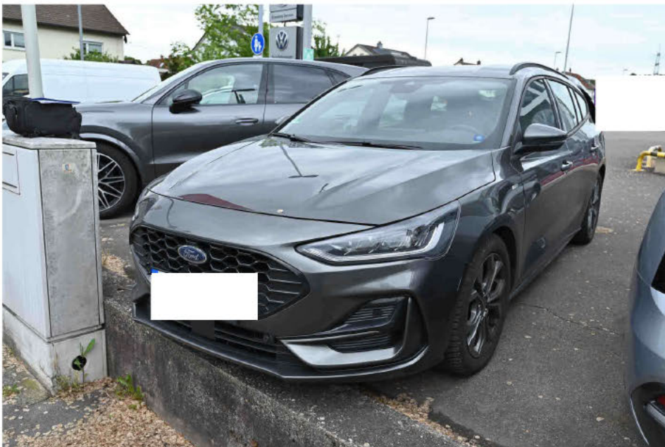
Bild 2 Frontansicht links