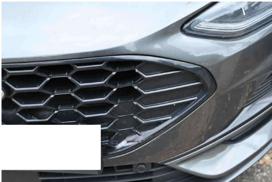
Bild 16 Kühlergrill gebrochen