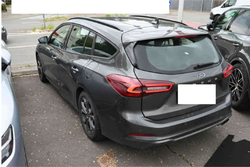
Bild 3 Heckansicht links