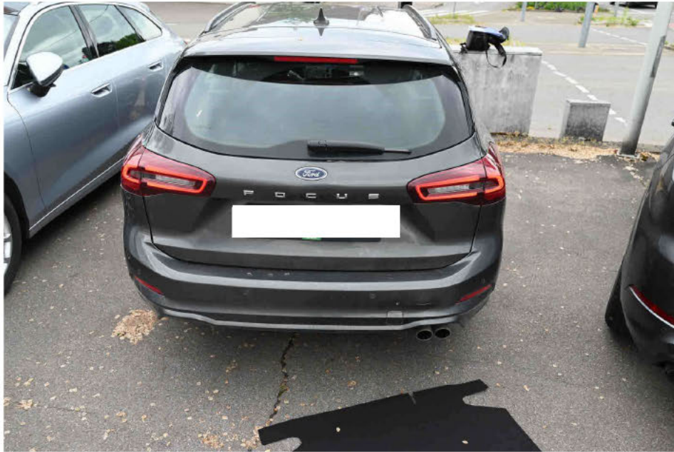
Bild 5 Übersicht Schadenbereich hinten