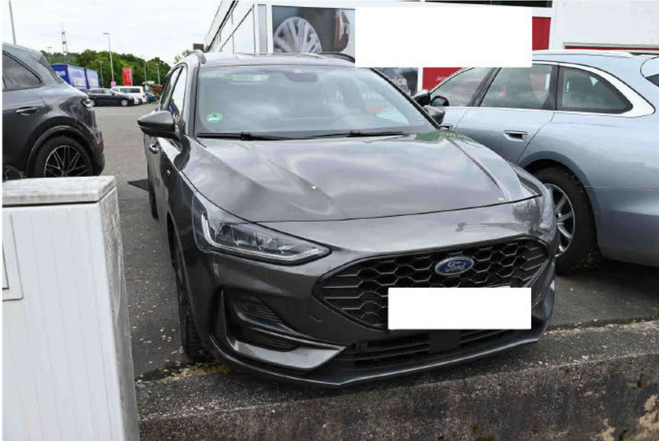
Bild 1 Frontansicht rechts