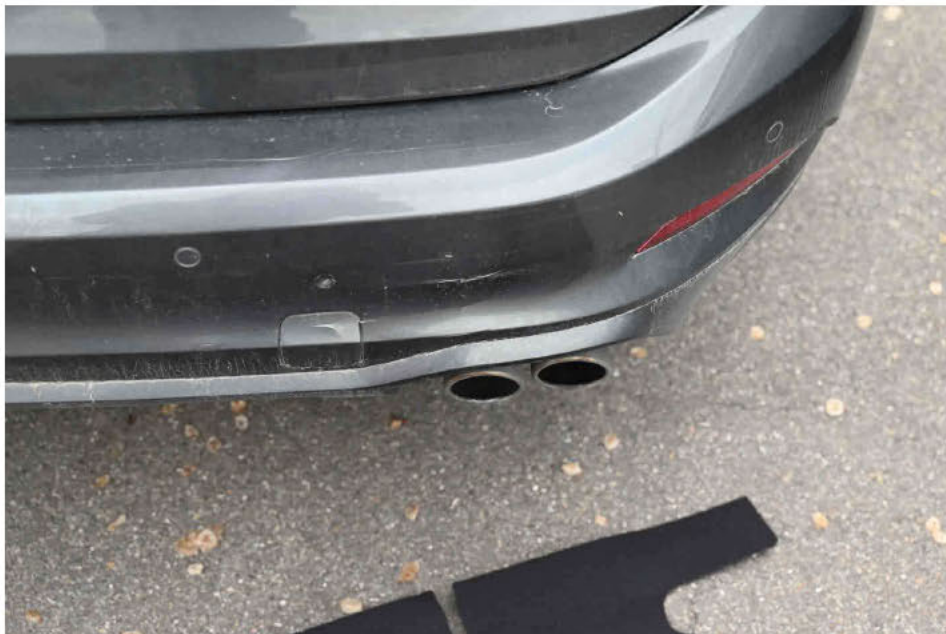
Bild 6 Stossfänger hinten verformt