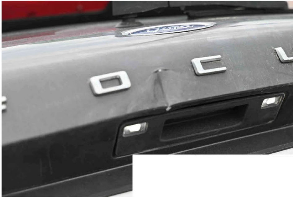
Bild 11 Heckklappe oben eingedrückt