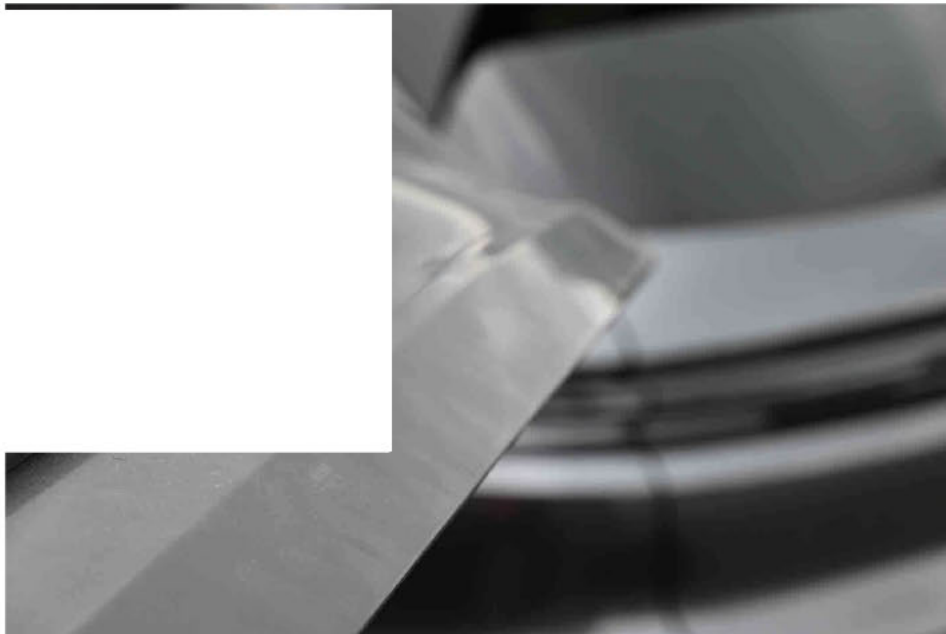
Bild 10 Kante Heckklappe verbogen