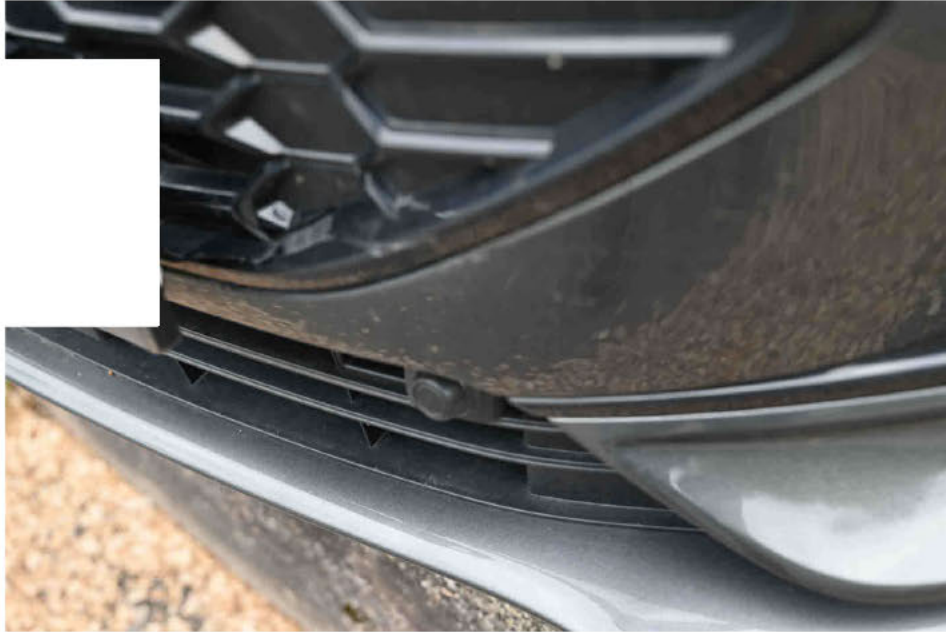
Bild 17 Stossfänger vorn verformt