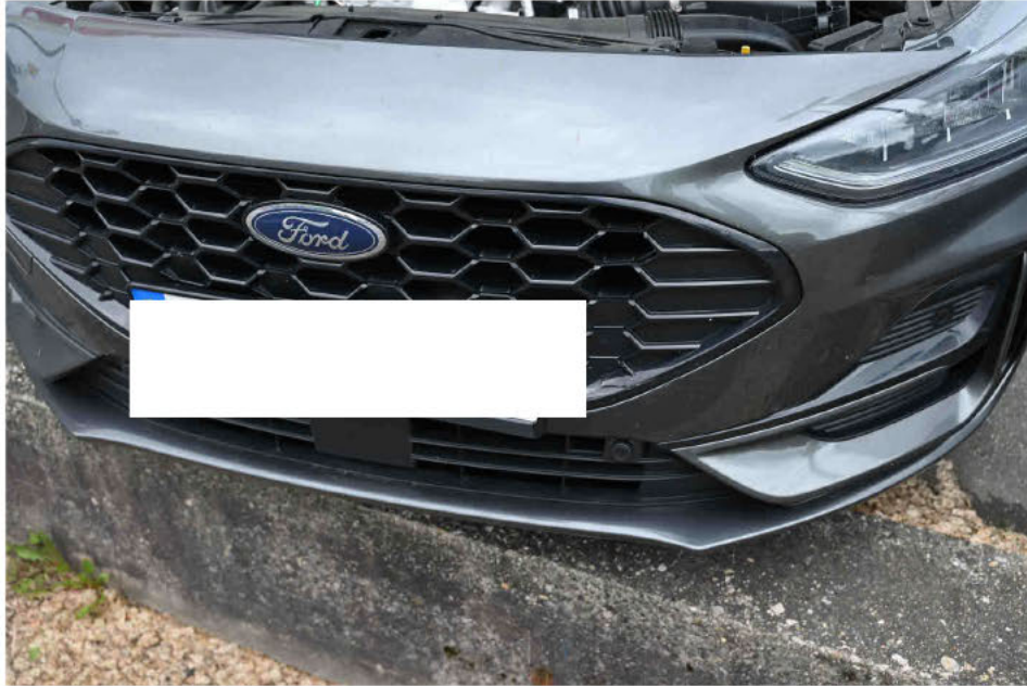
Bild 15 Kennzeichen vorn verformt