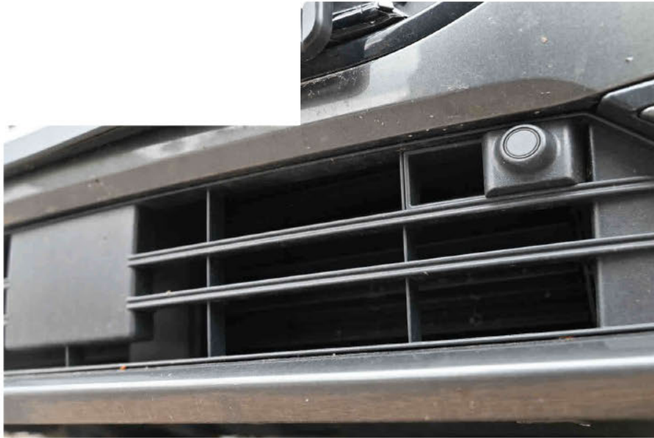
Bild 19 Träger vorn verbogen