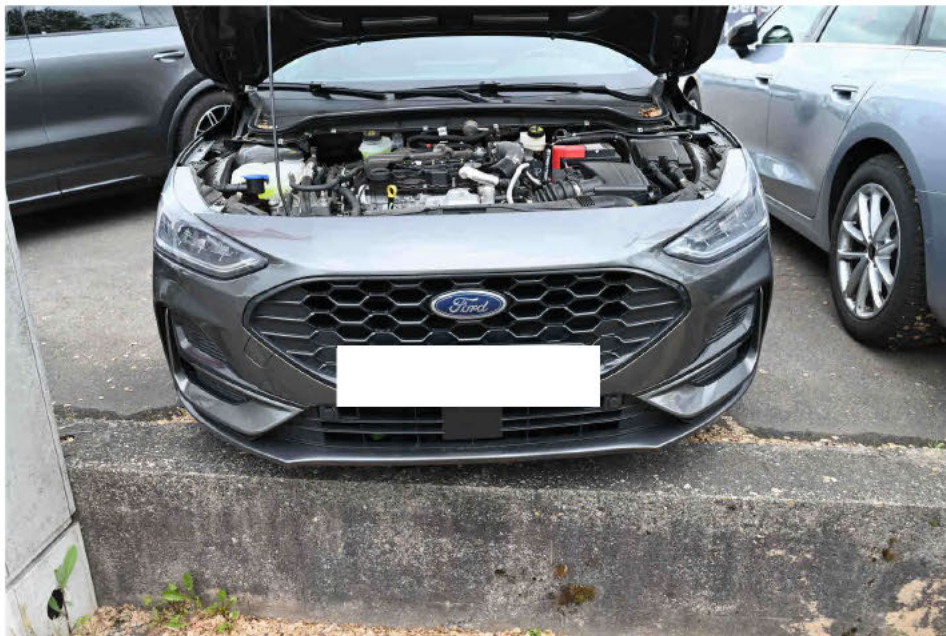
Bild 14 Übersicht Schadenbereich vorne