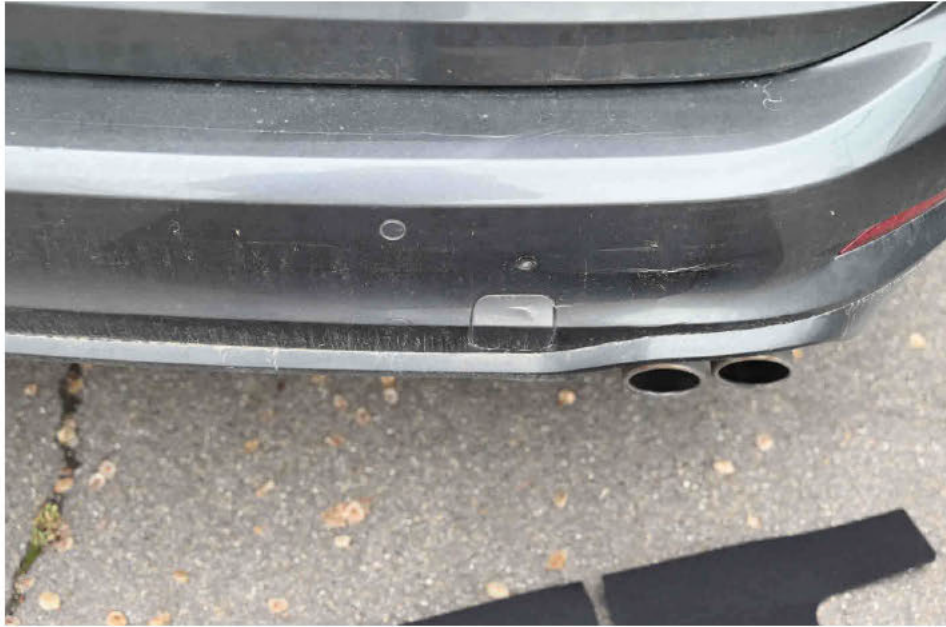
Bild 7 Blende hinten unten gebrochen