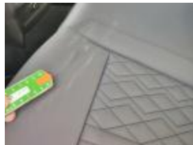
Puerta Delant Iz