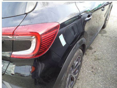
Aile / Arrière Droit / Rayure