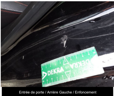
Entrée de porte / Arrière Gauche / Enfouissement