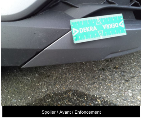
Spoiler / Avant / Enfouissement