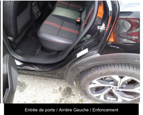
Entrée de porte / Arrière Gauche / Enfouissement