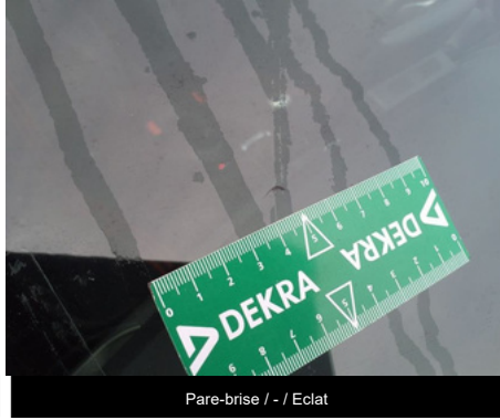
Pare-brise / - / Eclat