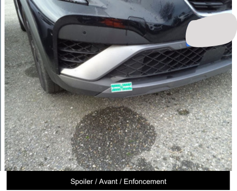
Spoiler / Avant / Enfouissement