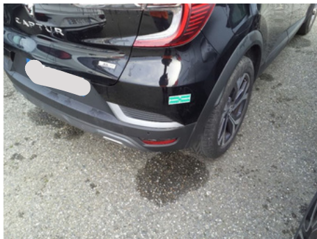
Pare-chocs / Arrière Droit / Rayure