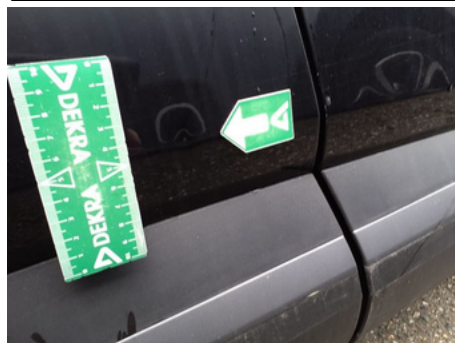
Porte / Arrière Droit / Enfoncement