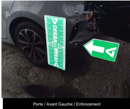
Porte / Avant Gauche / Enfouissement