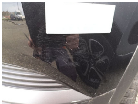
Pare-chocs / Arrière Droit / Rayure