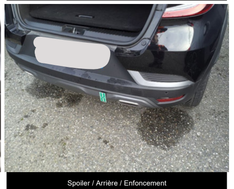
Spoiler / Arrière / Enfouissement