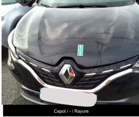
Capot / - / Rayure