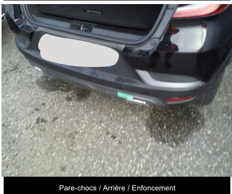
Pare-chocs / Arrière / Enfouissement