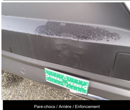
Pare-chocs / Arrière / Enfouissement