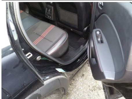
Entrée de porte / Arrière Droit / Enfoncement