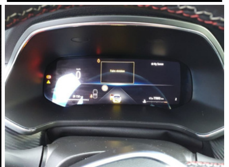
Voyant maintenance / Manquant