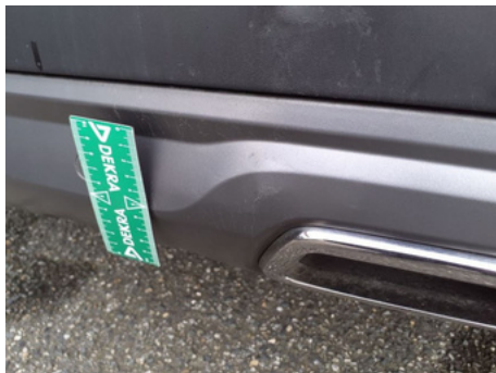
Spoiler / Arrière / Enfoncement