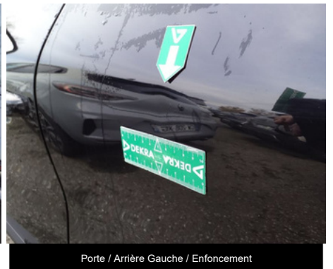
Porte / Arrière Gauche / Enfouissement