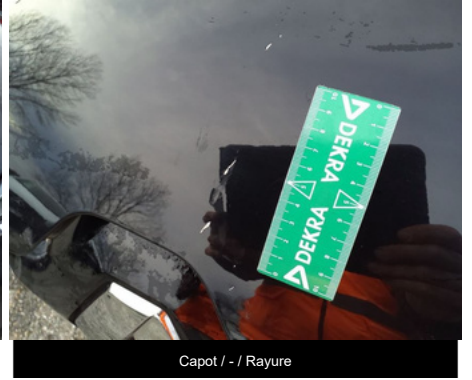
Capot / - / Rayure