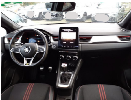
Planche de bord depuis le siège arrière