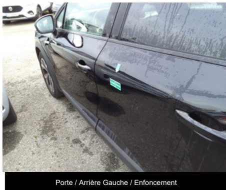
Porte / Arrière Gauche / Enfouissement