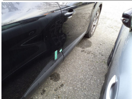
Porte / Arrière Droit / Enfoncement