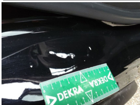
Entrée de porte / Arrière Droit / Enfoncement