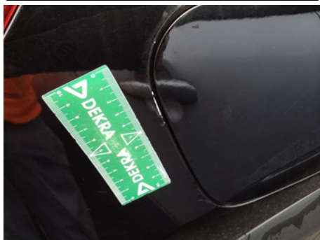
Aile / Arrière Droit / Rayure