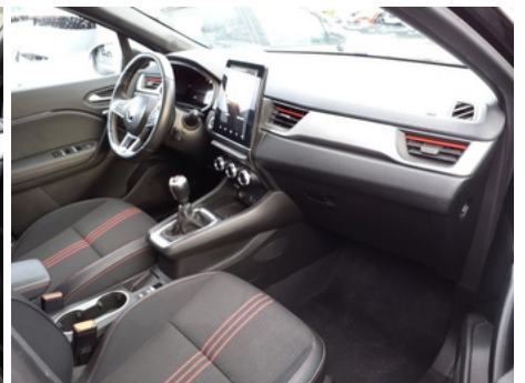
Compartiment passager avant