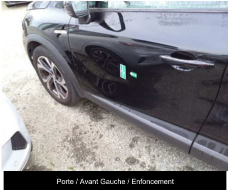
Porte / Avant Gauche / Enfouissement