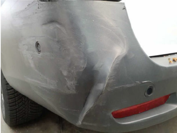
Beschädigung #7: Stossfänger hinten: Stossfänger mit Parktronic - gebrochen / gerissen - erneuern