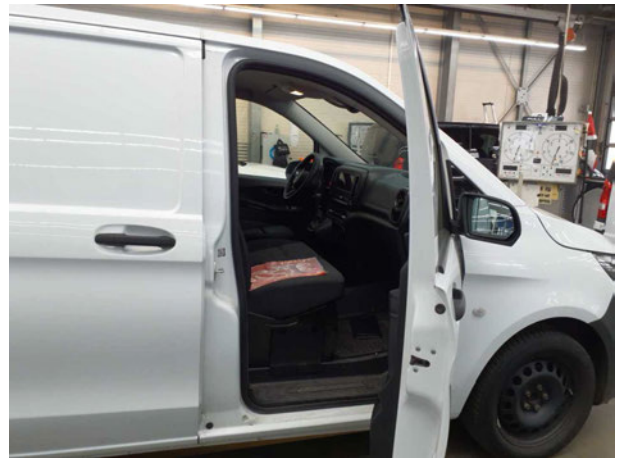
Abbildung 14: Innenraum