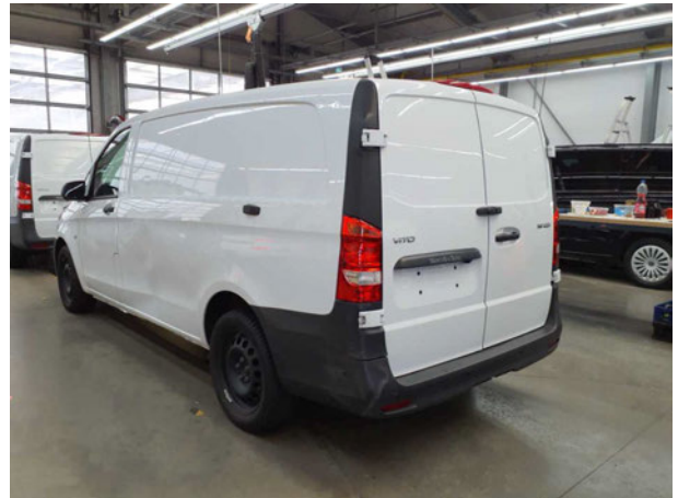
Abbildung 4: Schräg hinten