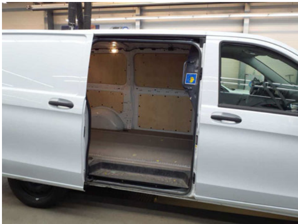
Abbildung 13: Innenraum