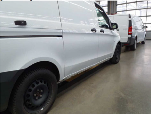
Beschädigung #9: Schiebetür rechts: Schiebetür - Delle / Lackschad... - instandsetzen/lackieren (S3)