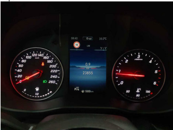
Beschädigung #3: Instrumententafel: Kontrollleuchte (Reifendruck) - Befund festlegen - Diagnose durchführen