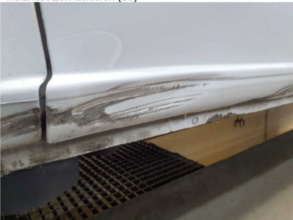
Beschädigung #9: Schiebetür rechts: Schiebetür - Delle / Lackschad... - instandsetzen/lackieren (S3)