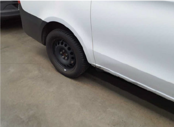
Beschädigung #4: Seitenwand rechts: Einstieg - Delle / Lackschade... instandsetzen und lackieren