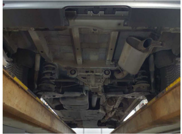
Abbildung 8: Unterboden