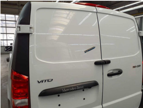
Beschädigung #2: Heckklappe/-tür: Hecktür links - Delle(n) - Smart Repair