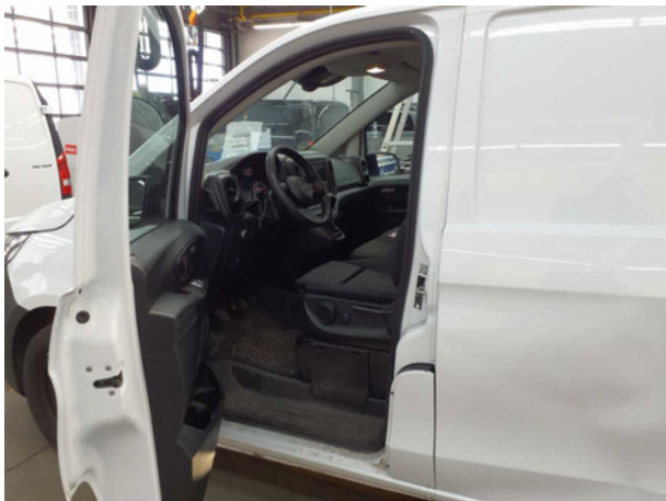
Abbildung 15: Innenraum