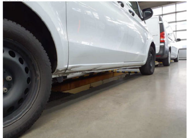
Beschädigung #6: Schweller rechts: Schweller - verformt - instandsetzen und lackieren