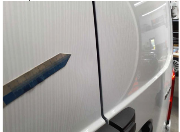
Beschädigung #2: Heckklappe/-tür: Hecktür links - Delle(n) - Smart Repair