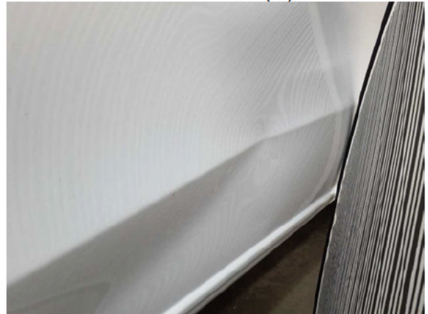
Beschädigung #10: Seitenwand links: Seitenwand - Delle / Lackschaden - instandsetzen/lackieren (S3)