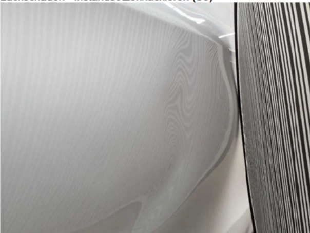
Beschädigung #10: Seitenwand links: Seitenwand - Delle / Lackschaden - instandsetzen/lackieren (S3)