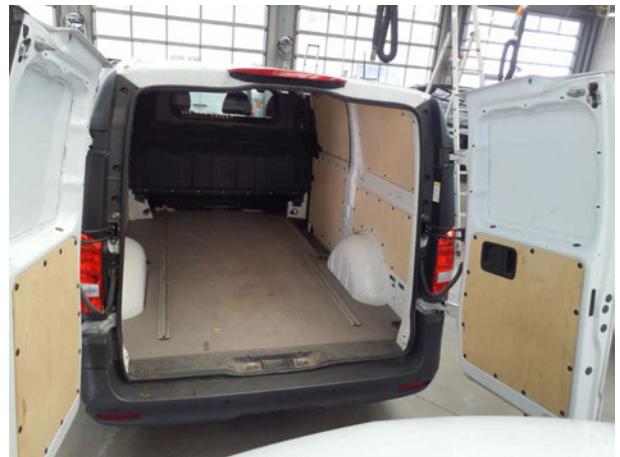
Abbildung 16: Innenraum