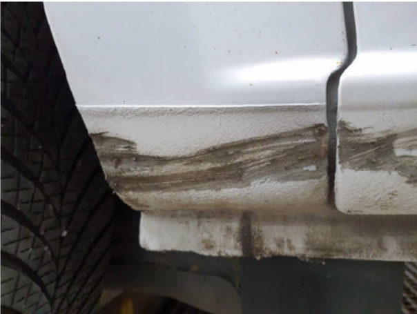
Beschädigung #4: Seitenwand rechts: Einstieg - Delle / Lackschade... instandsetzen und lackieren