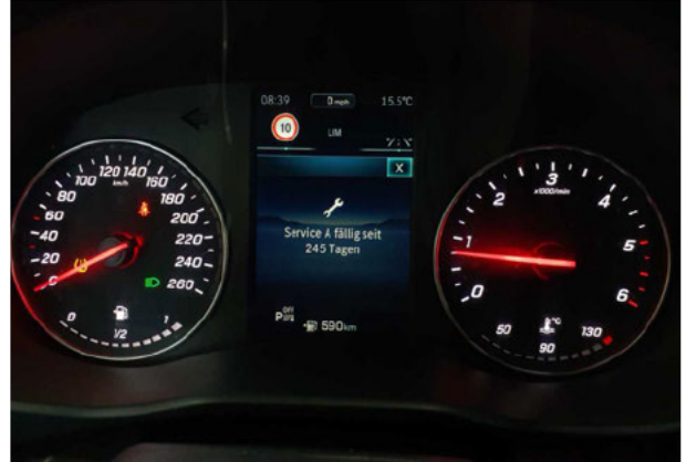
Beschädigung #8: Sonstiges: Inspektion/Wartung - fällig - erneuern