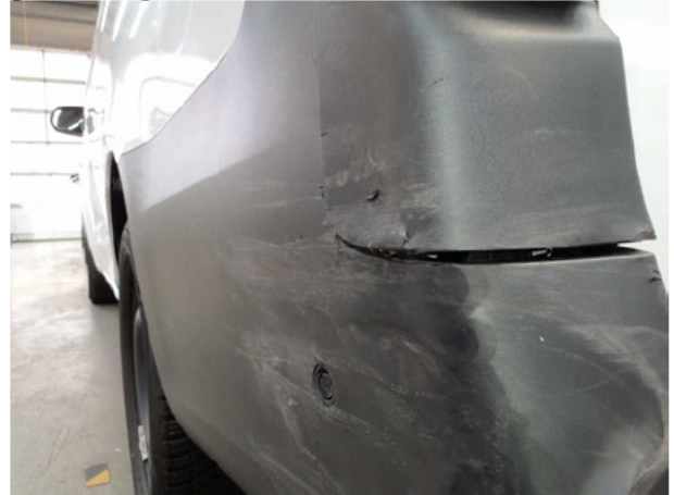
Beschädigung #7: Stossfänger hinten: Stossfänger mit Parktronic... gebrochen / gerissen - erneuern