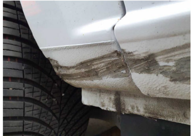
Beschädigung #4: Seitenwand rechts: Einstieg - Delle / Lackschaden - instandsetzen und lackieren