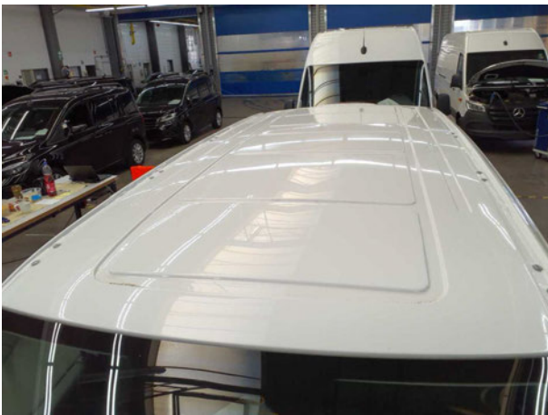
Abbildung 5: Fahrzeugdach