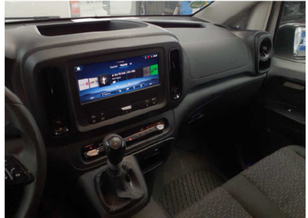
Abbildung 20: Sonstiges