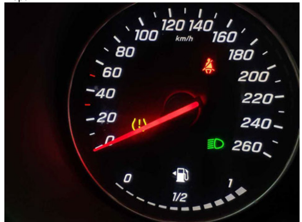
Beschädigung #3: Instrumententafel: Kontrollleuchte (Reifendruck) - Befund festlegen - Diagnose durchführen