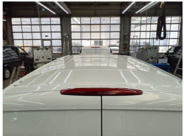
Abbildung 6: Fahrzeugdach