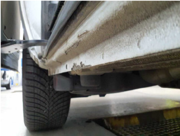
Beschädigung #6: Schweller rechts: Schweller - verformt - instandsetzen und lackieren