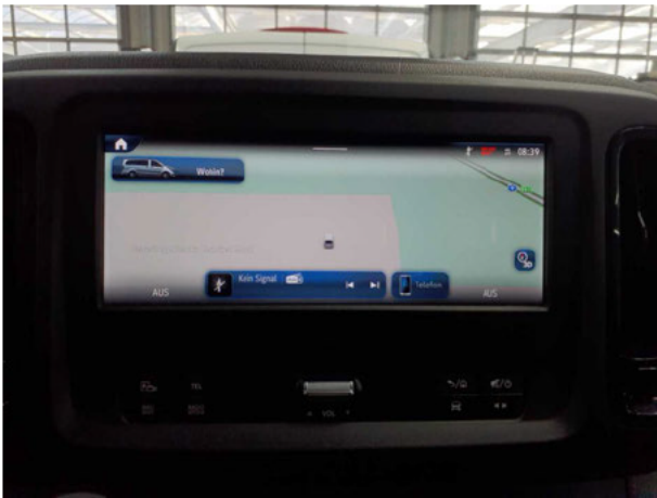
Abbildung 21: Sonstiges