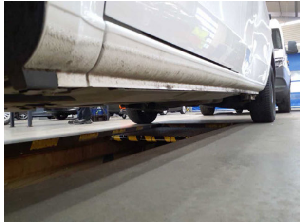
Abbildung 10: Schweller