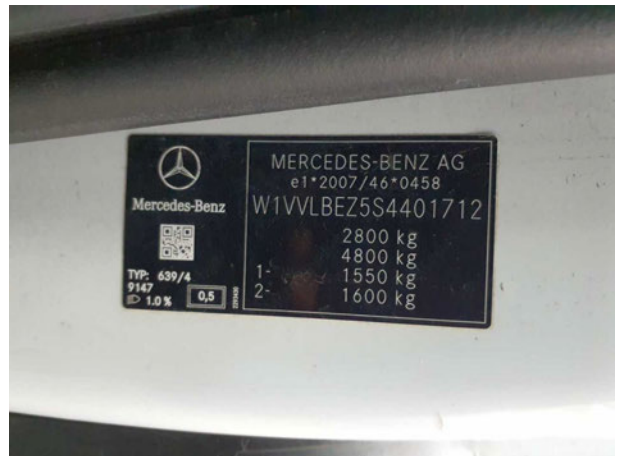
Abbildung 12: FIN