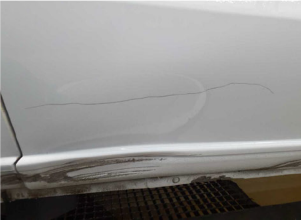
Beschädigung #9: Schiebetür rechts: Schiebetür - Delle / Lackschad... - instandsetzen/lackieren (S3)