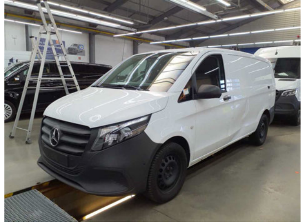
Abbildung 2: Schräg vorne