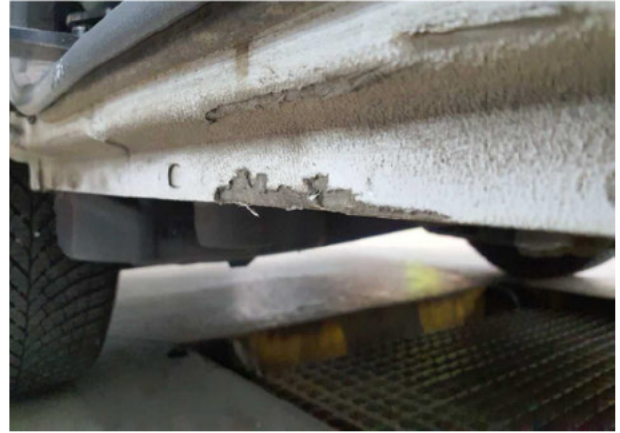
Beschädigung #6: Schweller rechts: Schweller - verformt - instandsetzen und lackieren