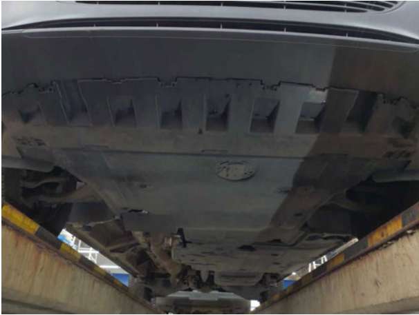
Abbildung 7: Unterboden