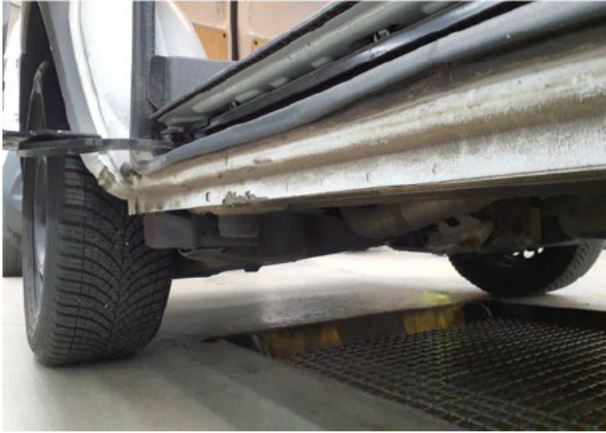
Beschädigung #6: Schweller rechts: Schweller - verformt - instandsetzen und lackieren