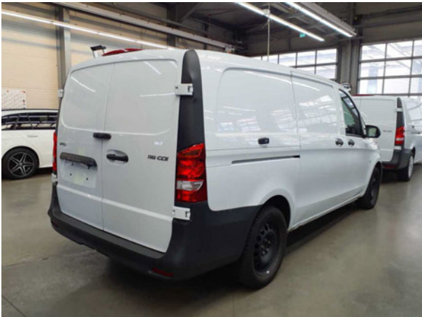
Abbildung 3: Schräg hinten