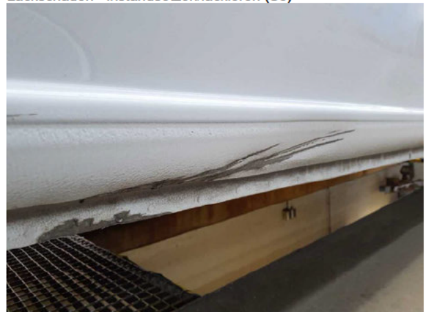
Beschädigung #9: Schiebetür rechts: Schiebetür - Delle / Lackschaden - instandsetzen/lackieren (S3)