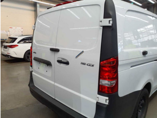
Beschädigung #1: Heckklappe/-tür: Hecktür rechts - Delle(n) - Smart Repair