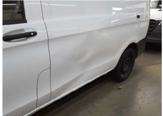
Beschädigung #10: Seitenwand links: Seitenwand - Delle / Lackschaden - instandsetzen/lackieren (S3)