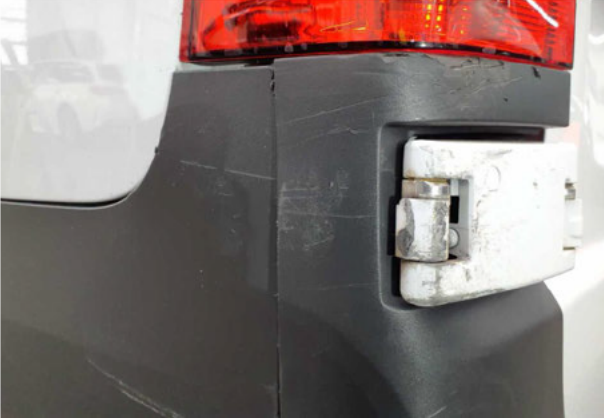
Beschädigung #7: Stossfänger hinten: Stossfänger mit Parktronic - gebrochen / gerissen - erneuern