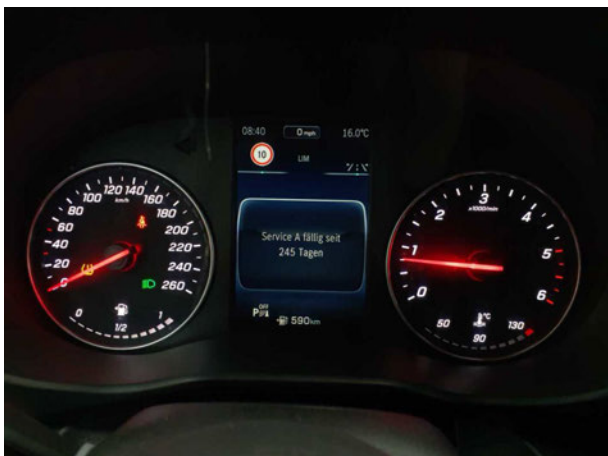
Abbildung 17: Kombiinstrument