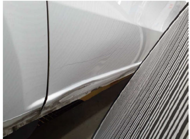
Beschädigung #9: Schiebetür rechts: Schiebetür - Delle / Lackschaden - instandsetzen/lackieren (S3)