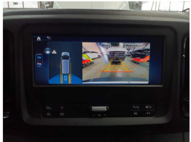
Abbildung 22: Sonstiges