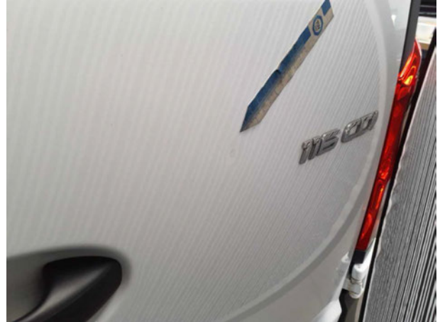
Beschädigung #1: Heckklappe/-tür: Hecktür rechts - Delle(n) - Smart Repair