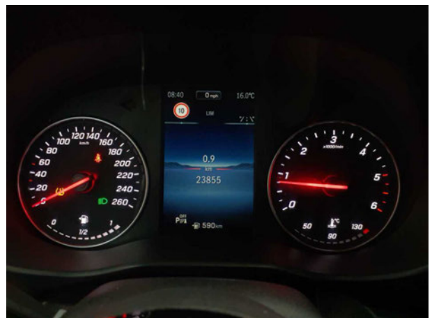
Abbildung 18: Kombiinstrument