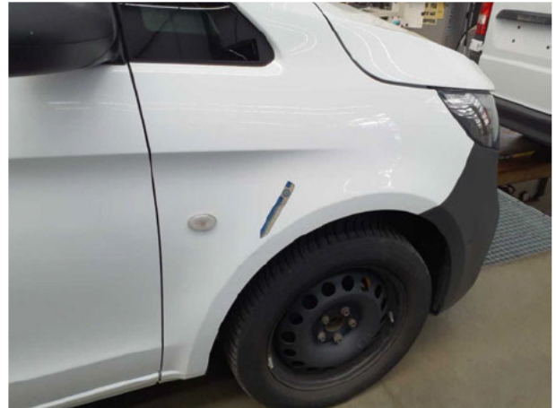
Beschädigung #5: Kotflügel rechts: Kotflügel rechts - Kratzer - lackieren