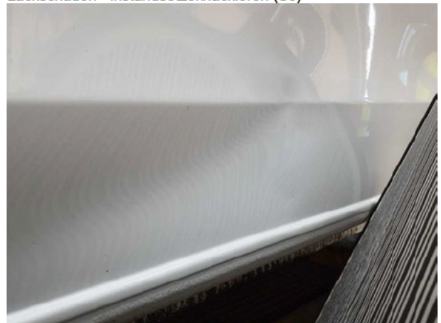
Beschädigung #10: Seitenwand links: Seitenwand - Delle / Lackschaden - instandsetzen/lackieren (S3)