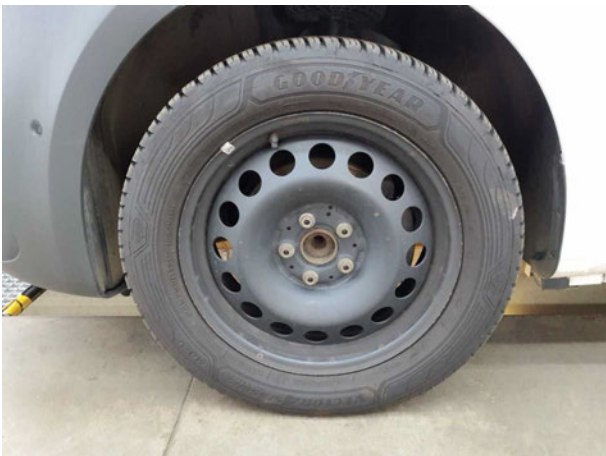
Abbildung 11: Montierte Bereifung