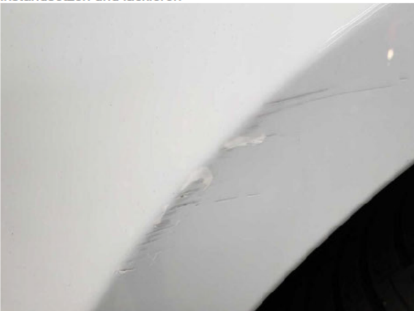
Beschädigung #5: Kotflügel rechts: Kotflügel rechts - Kratzer - lackieren