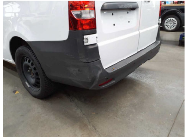
Beschädigung #7: Stossfänger hinten: Stossfänger mit Parktronic... gebrochen / gerissen - erneuern