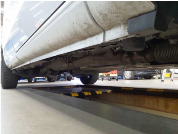
Abbildung 9: Schweller