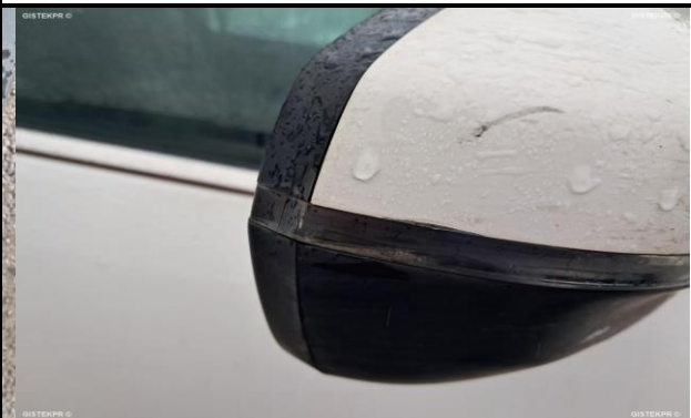
Foto daños externos 1