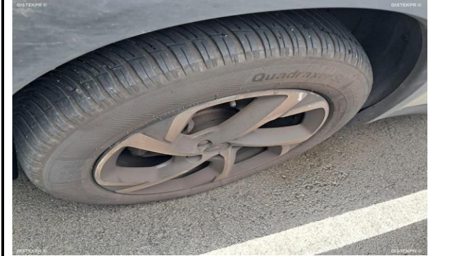
FLLAN 20250707 102029