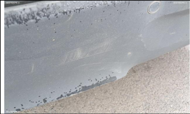
Foto daños externos 1