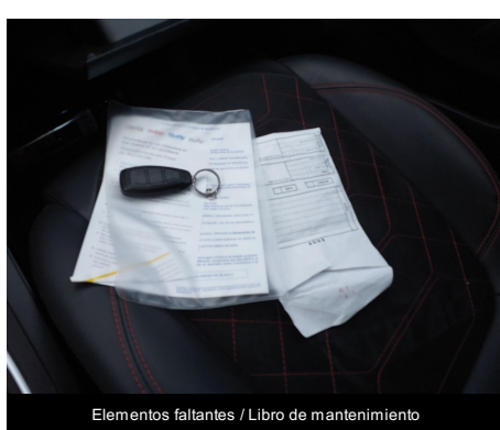
Elementos faltantes / Libro de mantenimiento