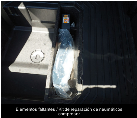
Elementos faltantes / Kit de reparación de neumáticos compresor