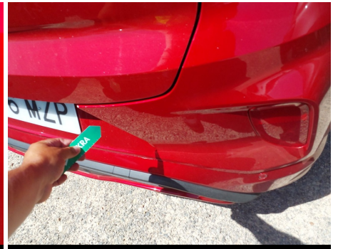
Paragolpes / Trasero / Rayado