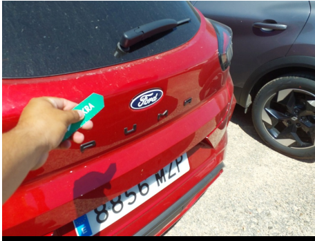
Portón trasero / puerta del maletero / - / Abolladura