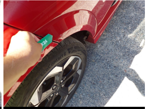
Moldura de puerta / Trasero Derecho / Rayado