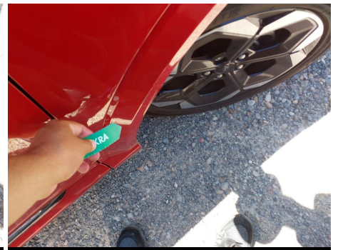
Moldura de aleta / Delantero Derecho / Rayado