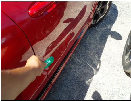
Puerta / Delantero Derecho / Abolladura