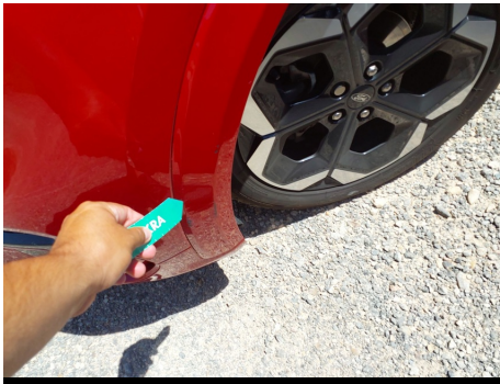
Moldura de aleta / Delantero Izquierdo / Rayado