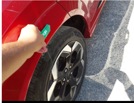
Moldura de aleta / Trasero Derecho / Rayado