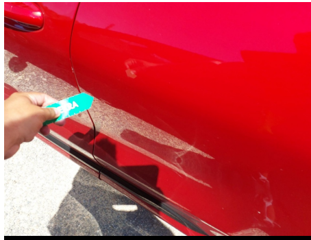
Puerta / Trasero Izquierdo / Abolladura