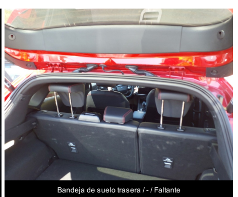
Bandeja de suelo trasera / - / Faltante