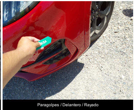
Paragolpes / Delantero / Rayado