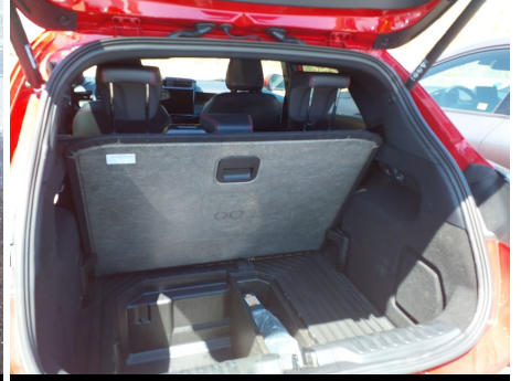
Elementos faltantes / Cubierta de carga