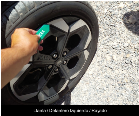
Llanta / Delantero izquierdo / Rayado