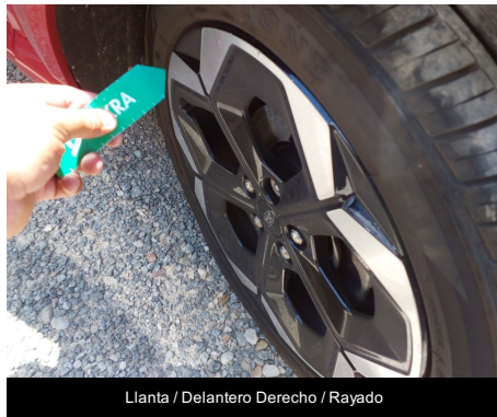
Llanta / Delantero Derecho / Rayado