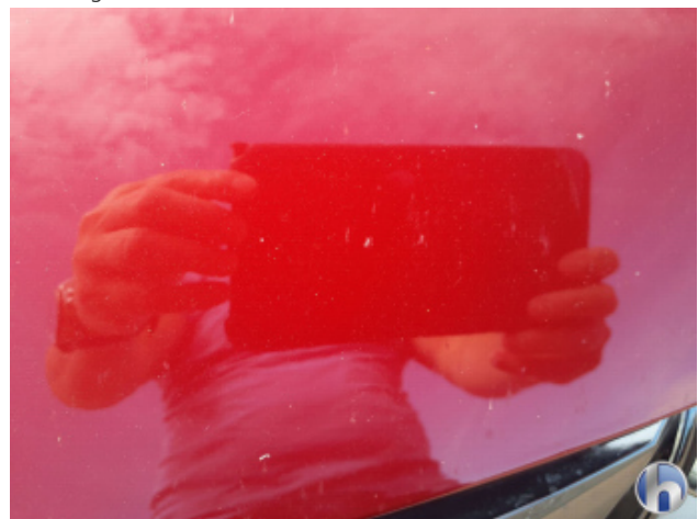
1. Motorhaube Gebrauchsspuren - Ohne Reparatur