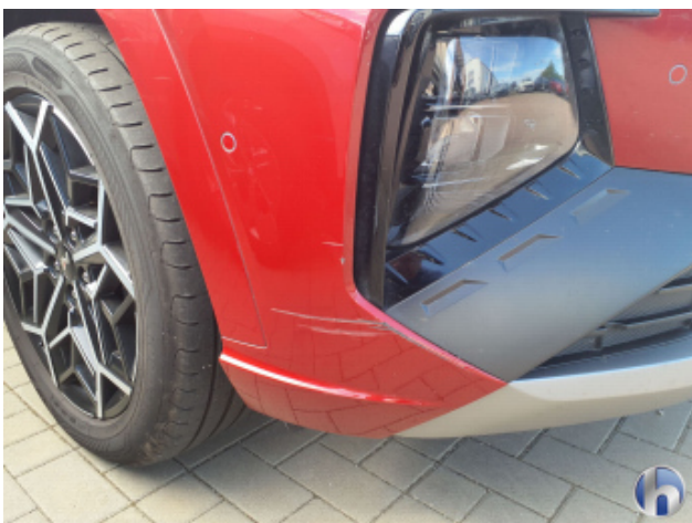
2. Stoßfänger Vorne

Beschädigt - Instandsetzen und Lackieren