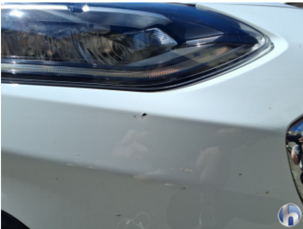
1. Stoßfänger Vorne Gebrauchsspuren - Ohne Reparatur