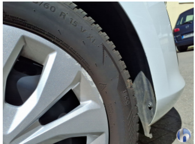
2. Radkappe - Vorne - Rechts Beschädigt - Erneuern