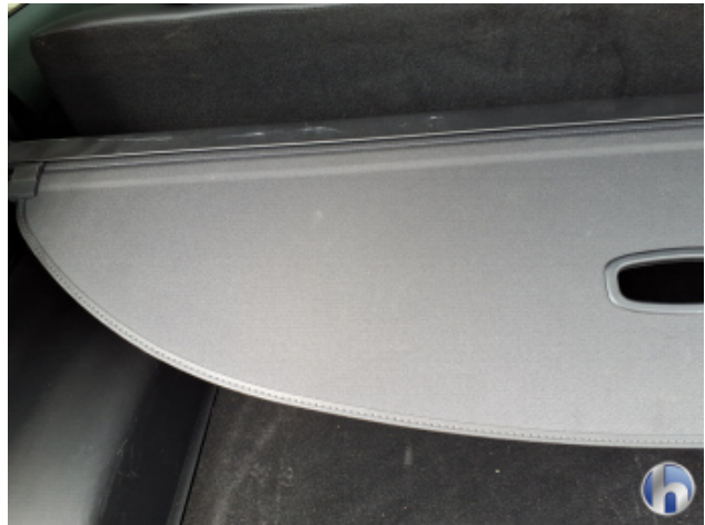
2. Innenraum Verschmutzt - Reinigen