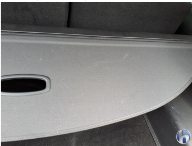
2. Innenraum Verschmutzt - Reinigen