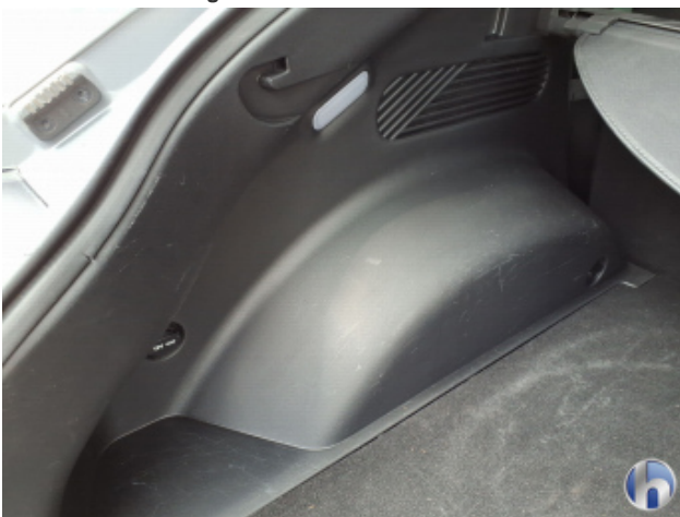
2. Innenraum Verschmutzt - Reinigen