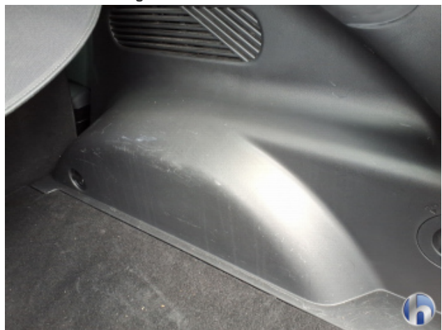
2. Innenraum Verschmutzt - Reinigen