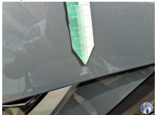
1. Kotflügel Vorne - Links Gebrauchsspuren - Ohne Reparatur