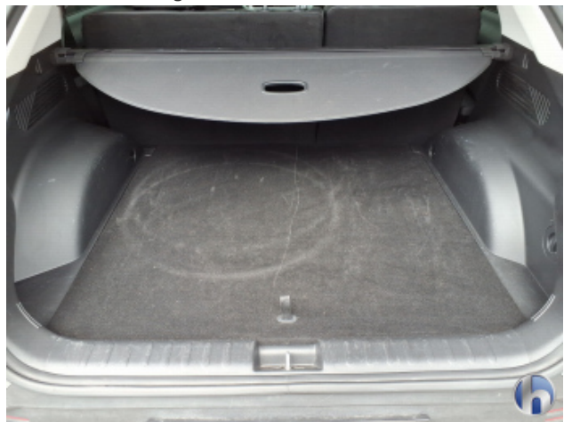
2. Innenraum Verschmutzt - Reinigen