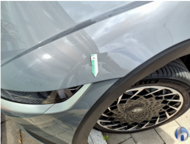
1. Kotflügel Vorne - Links Gebrauchsspuren - Ohne Reparatur