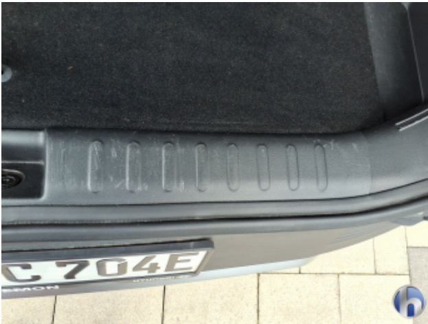
2. Innenraum Verschmutzt - Reinigen