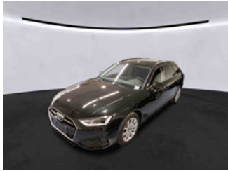
Fahrzeugansicht - diagonal vorne links

Auftrags-Nr: 1002240813 Besichtigt am: 14.01.2026 11:11 Berichts-Nr: 9838899 FIN: WAUZZZF45PA016997