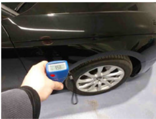
Lackstärke Kotflügel vorne rechts