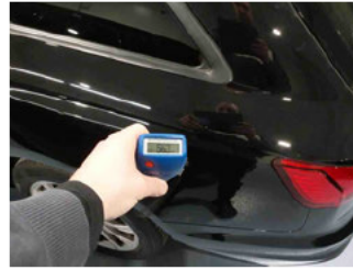
Lackstärke Seitenwand hinten links