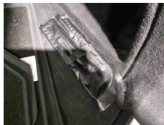
Equipment - Bordwerkzeug