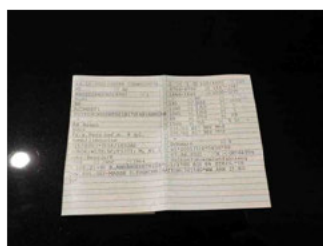
Fahrzeug - abgegebene ZB1