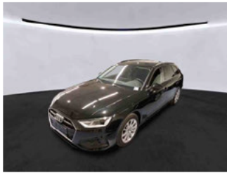
Fahrzeugansicht - diagonal vorne links