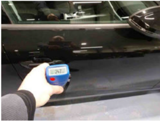
Lackstärke Tür vorne rechts