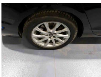
Räder - Rad montiert hinten rechts