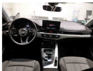
Innenraum - Mittelkonsole