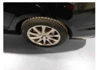
Räder - Rad montiert hinten links