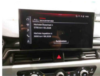
Fahrzeug - Serviceunterlagen / Wartungsnachweis