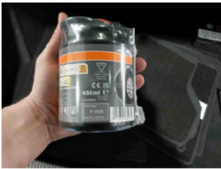
Räder - Haltbarkeitsdatum Tirefit