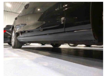
Seitenansicht - Schweller rechts