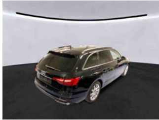
Fahrzeugansicht - diagonal hinten rechts