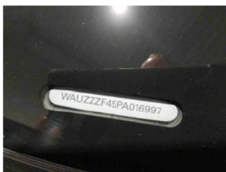
Fahrzeug - Typenschild/Fahrgestellnummer