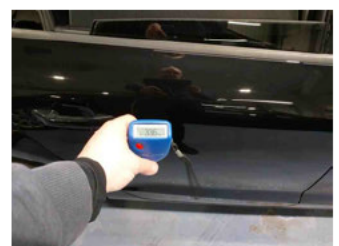
Lackstärke Tür hinten rechts