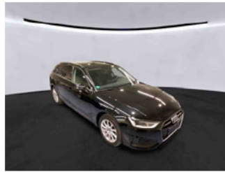
Fahrzeugansicht - diagonal vorne rechts