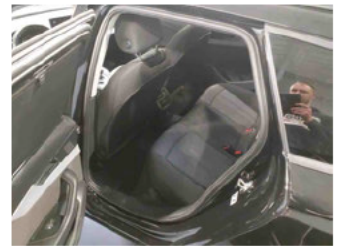
Innenraum - hinten