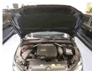
Fahrzeug - Motorraum offen