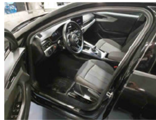
Innenraum - vorne