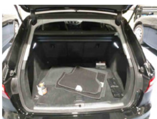
Innenraum - Kofferraum