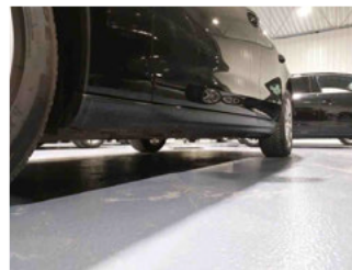
Seitenansicht - Schweller links