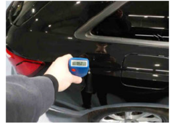
Lackstärke Seitenwand hinten rechts