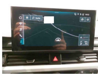
Innenraum - Navigationsgerät/Radio