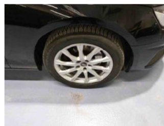
Räder - Rad montiert vorne rechts