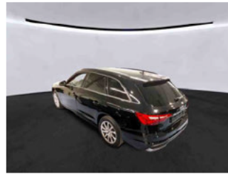
Fahrzeugansicht - diagonal hinten links