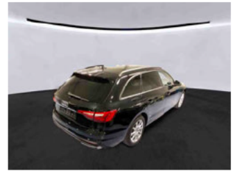
Fahrzeugansicht - diagonal hinten rechts