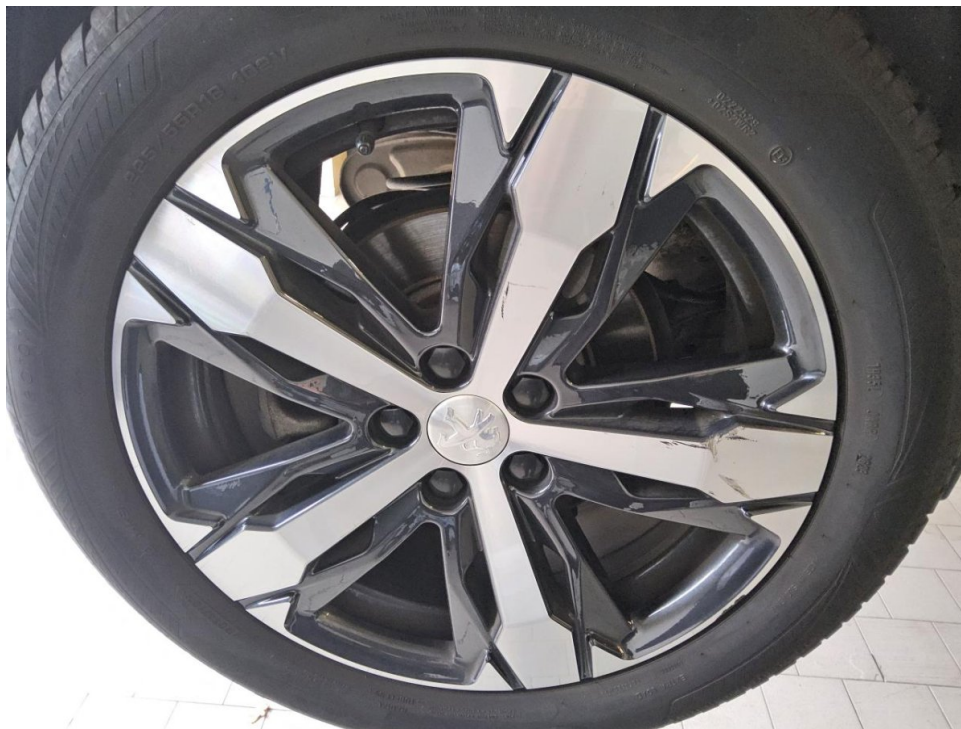
Felge (Ganzjahres-Radsatz) - Hinterachse rechts - Erneuern