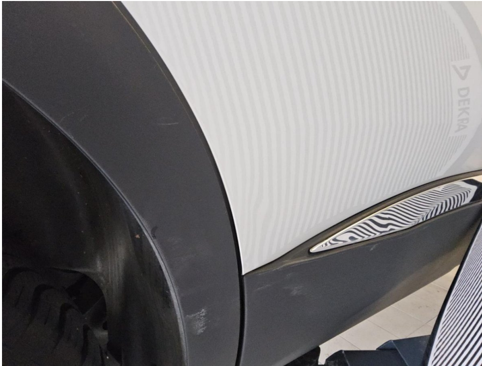
Tür hinten rechts - Instands. und lackieren

Anzahl Halter lt. Zulbesch. II: keine Angabe