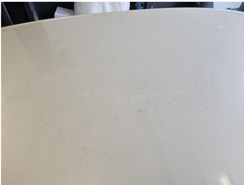
Dach leicht verwittert polieren