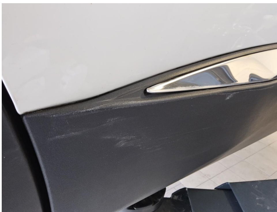
Tür HR Leiste Kratzer