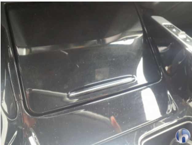
5. Mittelkonsole Innenraum vorne mitte Kratzer - Smart Repair