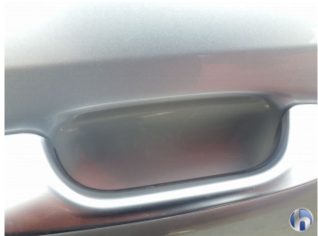
2. Tür Hinten - Rechts Gebrauchsspuren - Ohne Reparatur