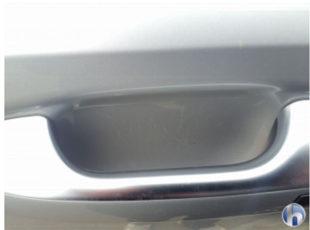
4. Tür Vorne - Links Kratzer - Smart Repair