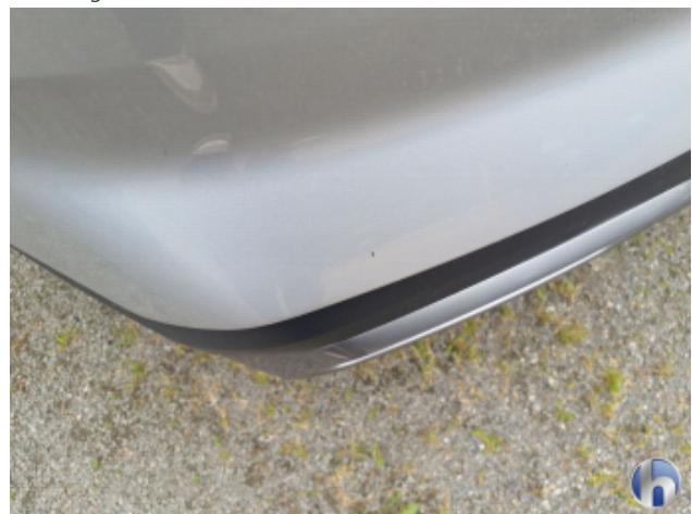
1. Stoßfänger Hinten Gebrauchsspuren - Ohne Reparatur