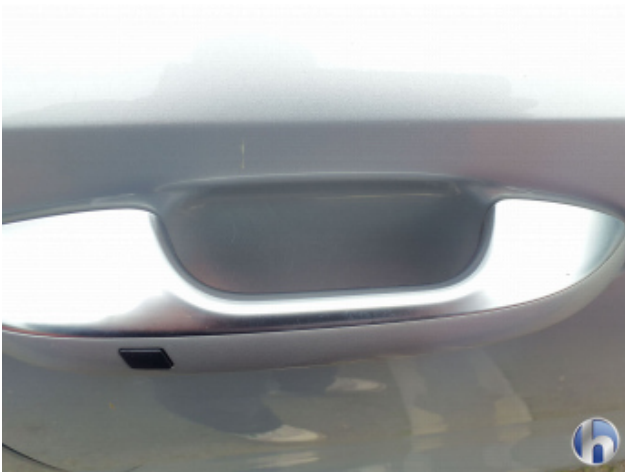
3. Tür Vorne - Rechts Gebrauchsspuren - Ohne Reparatur