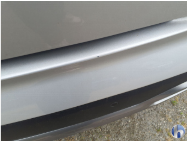
1. Stoßfänger Hinten Gebrauchsspuren - Ohne Reparatur