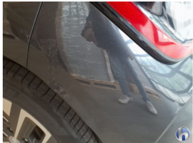
3. Stoßfänger Hinten Gebrauchsspuren - Ohne Reparatur