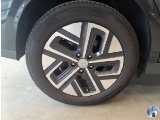
1. Felge Hinten - Rechts Gebrauchsspuren - Ohne Reparatur