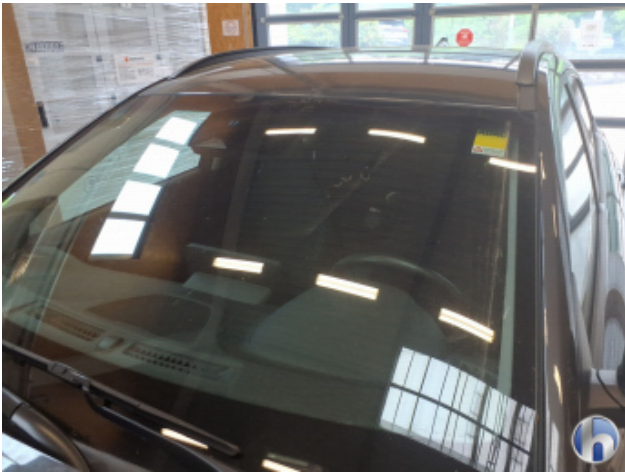
4. Windschutzscheibe Gebrauchsspuren - Ohne Reparatur