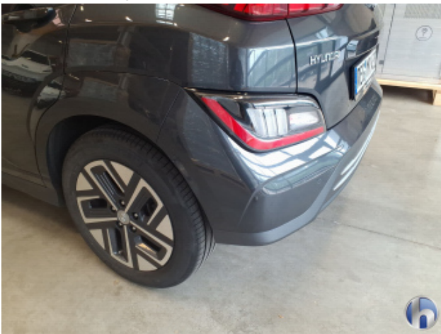
3. Stoßfänger Hinten Gebrauchsspuren - Ohne Reparatur