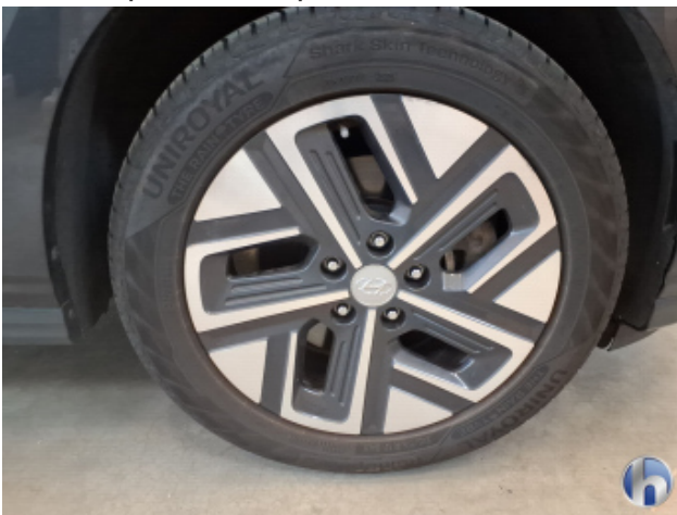
2. Felge Vorne - Rechts Kratzer - Smart Repair