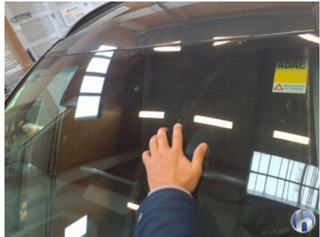
4. Windschutzscheibe Gebrauchsspuren - Ohne Reparatur