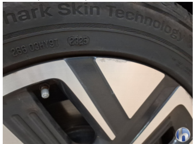
2. Felge Vorne - Rechts Kratzer - Smart Repair