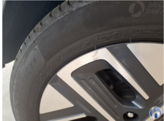
1. Felge Hinten - Rechts Gebrauchsspuren - Ohne Reparatur