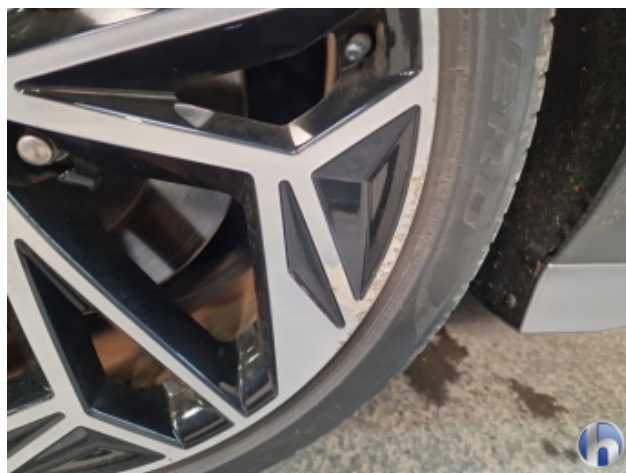
1. Felge Vorne - Links Beschädigt - Smart Repair