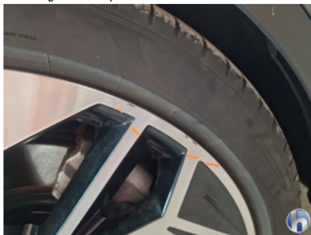
2. Felge Vorne - Rechts Beschädigt - Smart Repair