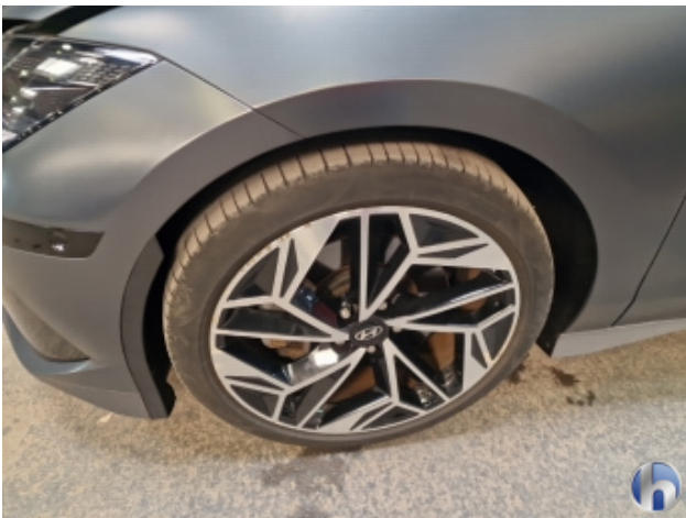
1. Felge Vorne - Links Beschädigt - Smart Repair