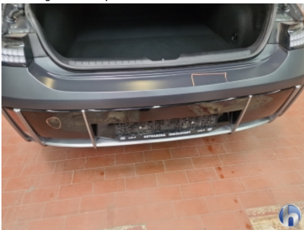
3. Stoßfänger Hinten Kratzer - Smart Repair