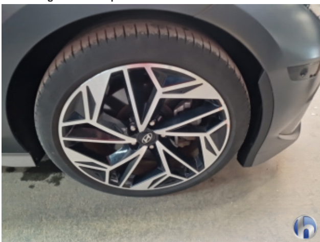
2. Felge Vorne - Rechts Beschädigt - Smart Repair