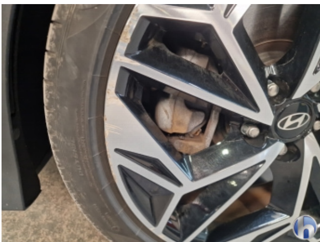
1. Felge Vorne - Links Beschädigt - Smart Repair