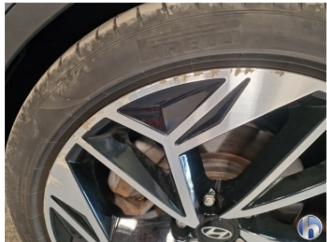
1. Felge Vorne - Links Beschädigt - Smart Repair