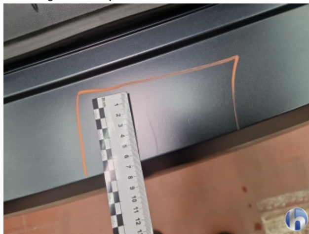
3. Stoßfänger Hinten Kratzer - Smart Repair