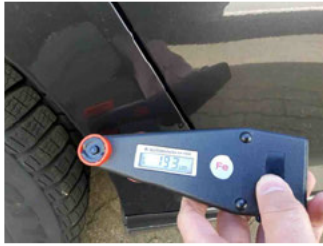
Lackstärke Seitenwand hinten rechts