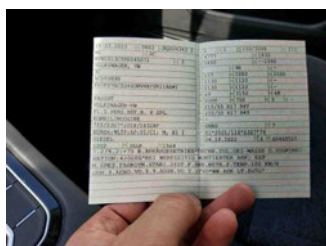
Fahrzeug - abgegebene ZB1