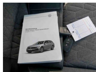
Equipment - Boardmappe/ Securitybag