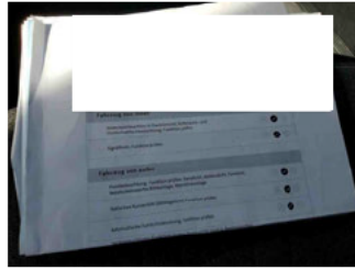
Fahrzeug - Serviceunterlagen / Wartungsnachweis