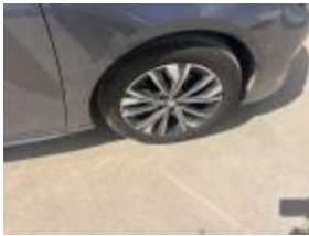
Caja Retrov Ext DR