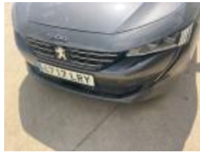
Reparar + Pintar