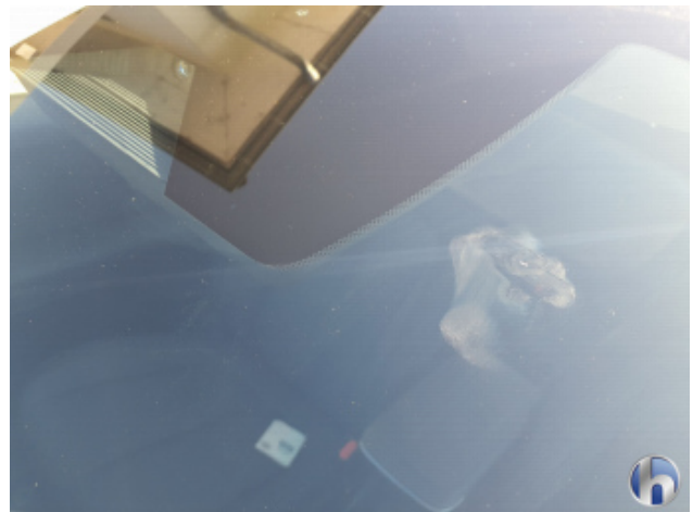
1. Windschutzscheibe Gebrauchsspuren - Ohne Reparatur