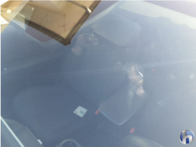
1. Windschutzscheibe Gebrauchsspuren - Ohne Reparatur