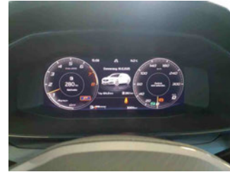
Innenraum - Cockpit mit Laufleistung