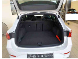
Innenraum - Kofferraum