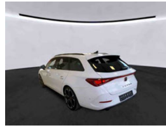
Fahrzeugansicht - diagonal hinten links