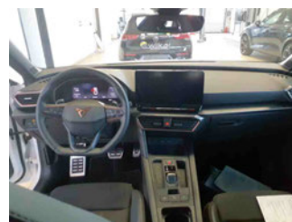
Innenraum - Mittelkonsole