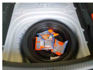
Räder - Ersatzrad