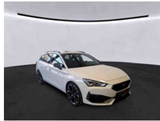
Fahrzeugansicht - diagonal vorne rechts