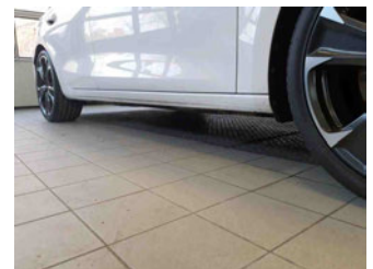
Seitenansicht - Schweller rechts