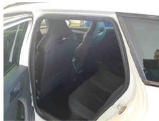
Innenraum - hinten