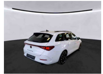
Fahrzeugansicht - diagonal hinten rechts