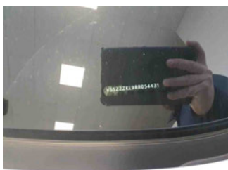
Fahrzeug - Typenschild/Fahrgestellnummer