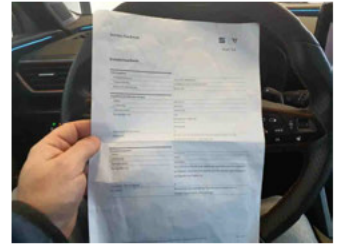
Fahrzeug - Serviceunterlagen / Wartungsnachweis