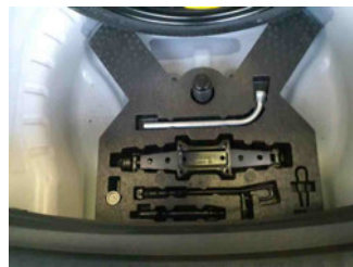
Equipment - Bordwerkzeug