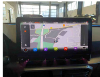
Innenraum - Navigationsgerät/Radio