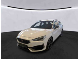
Fahrzeugansicht - diagonal vorne links

Auftrags-Nr: 1002244445 Besichtigt am: 18.12.2025 15:28 Berichts-Nr: 9705683 FIN: VSSZZZKL9RR054431