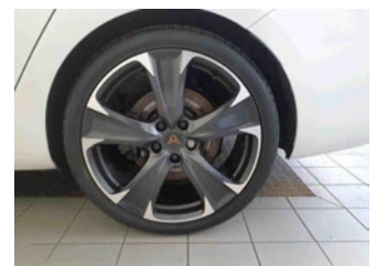
Räder - Rad montiert hinten links