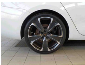
Räder - Rad montiert hinten rechts