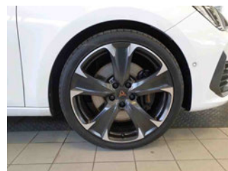
Räder - Rad montiert vorne rechts