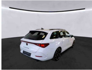
Fahrzeugansicht - diagonal hinten rechts