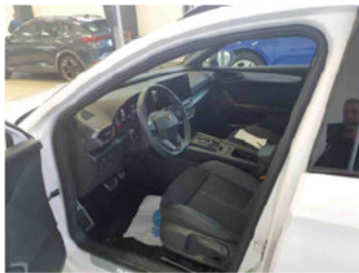
Innenraum - vorne