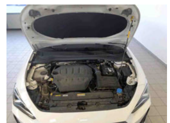
Fahrzeug - Motorraum offen