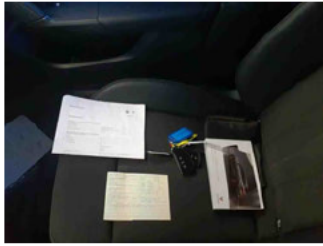
Equipment - Boardmappe/ Securitybag