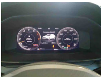
Innenraum - Cockpit mit Laufleistung