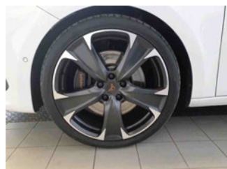
Räder - Rad montiert vorne links