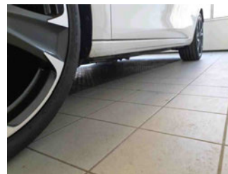
Seitenansicht - Schweller links