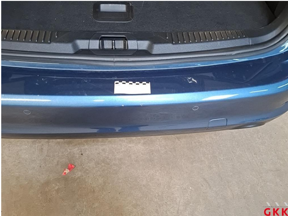
Bild 17 Stoßfänger hinten, Verkleidung -lackiert-, verkratzt, lackieren