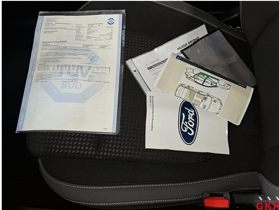
Bild 15 Inspektion groß, Mittelklasse, kein gültiger Nachweis vorhanden, durchführen