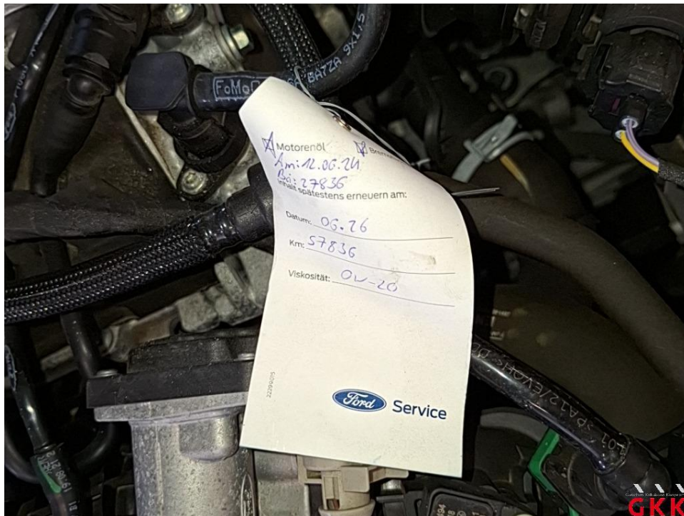
Bild 16 Inspektion groß, Mittelklasse, kein gültiger Nachweis vorhanden, durchführen