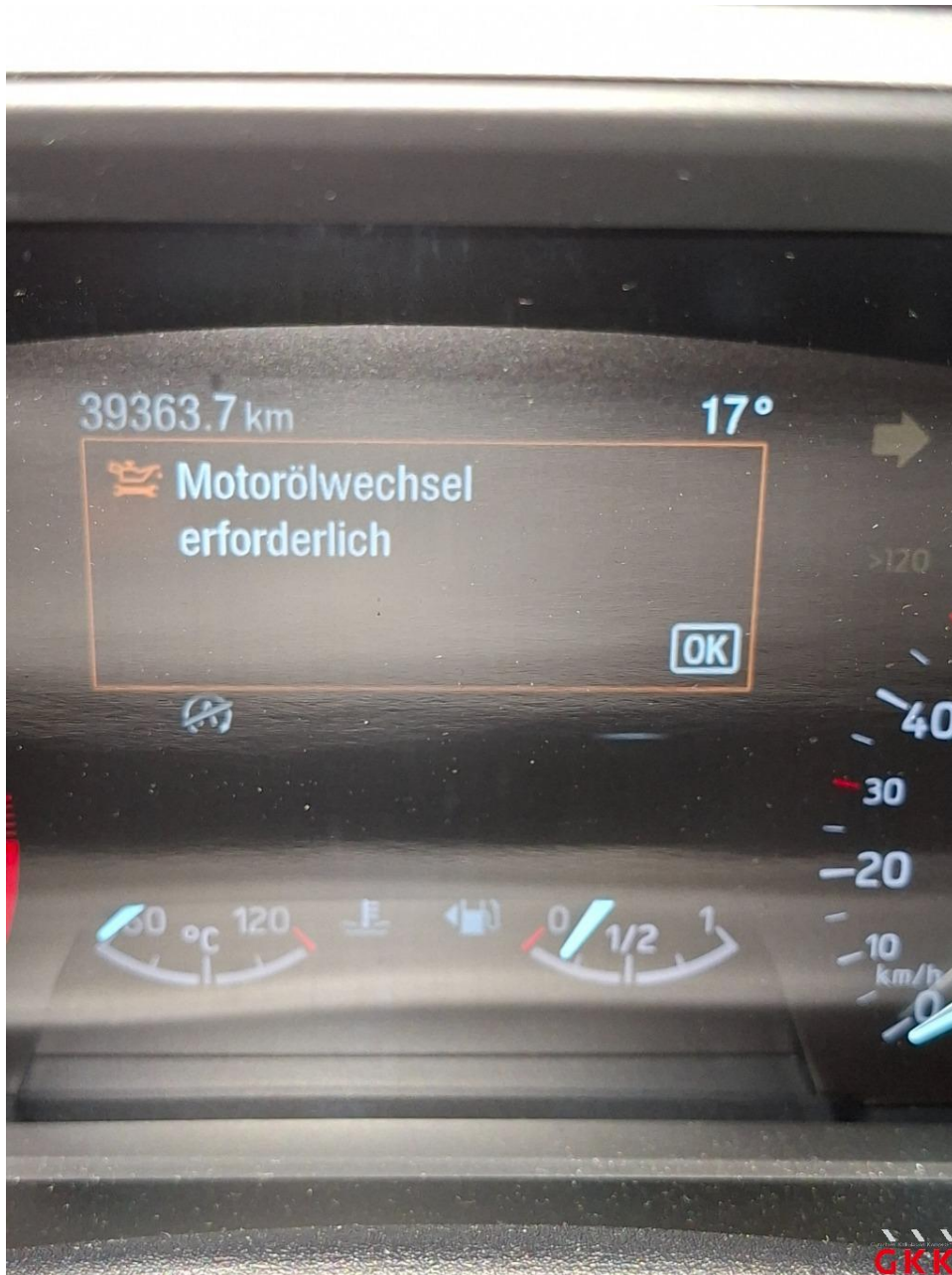
Bild 14 Inspektion groß, Mittelklasse, kein gültiger Nachweis vorhanden, durchführen