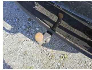
Equipment - Anhängerkupplung