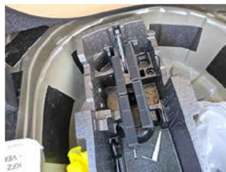
Equipment - Bordwerkzeug