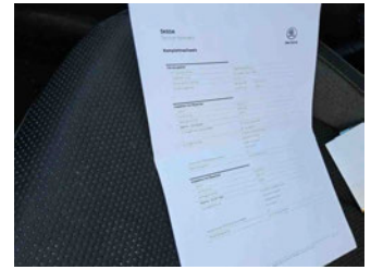
Fahrzeug - Serviceunterlagen / Wartungsnachweis