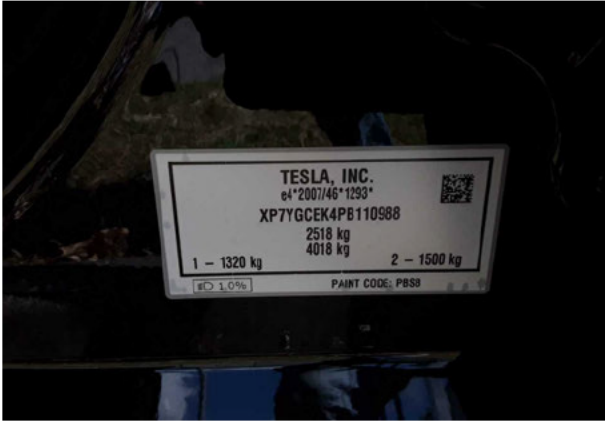
Abbildung 7: FIN