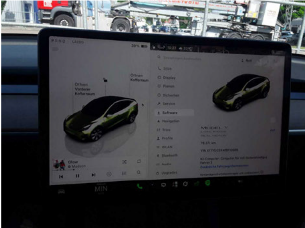
Abbildung 9: Kombiinstrument