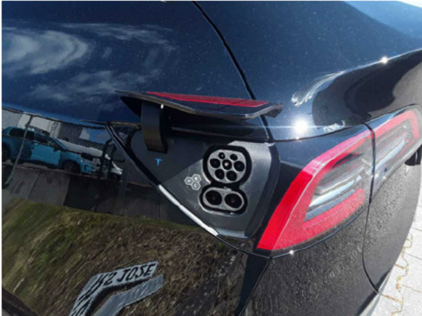
Abbildung 15: Ladebuchse/Tankstutzen