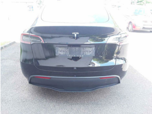
Beschädigung #1: Stossfänger hinten: Stossfänger hinten - verkratzt / verschürft - Smart Repair