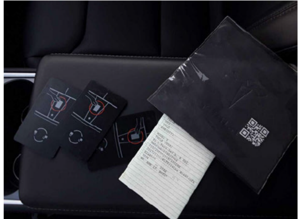
Abbildung 16: Sonstiges