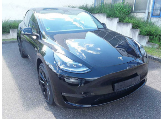
Abbildung 2: Schräg vorne