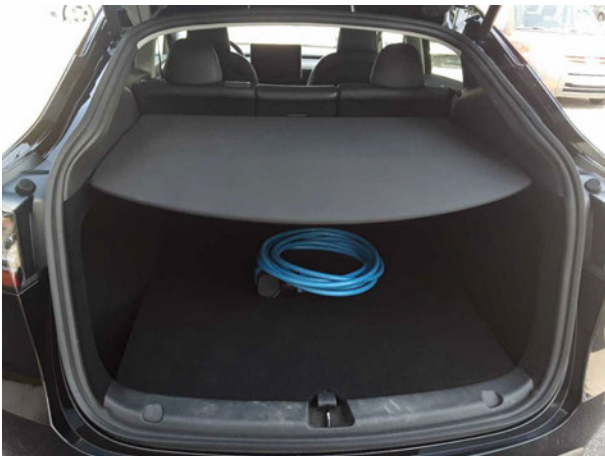
Abbildung 5: Laderaum