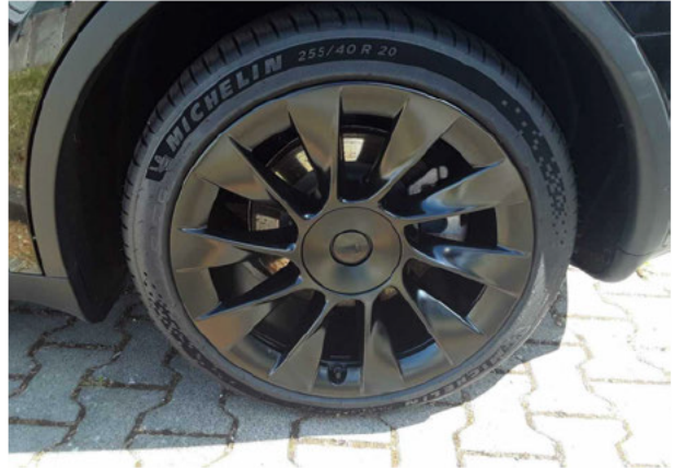
Abbildung 14: Montierte Bereifung