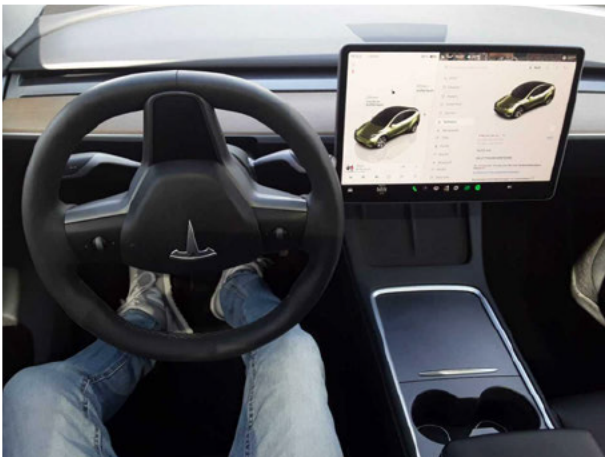
Abbildung 11: Instrumententafel