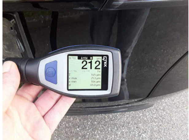
Nachlackierung 1: Heckklappe/-tür, Schweller rechts