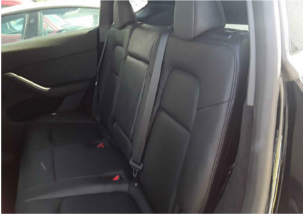
Abbildung 13: Innenraum hinten