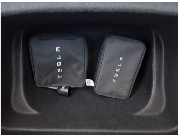
Abbildung 17: Sonstiges