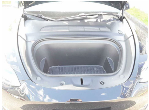
Abbildung 6: Motorraum