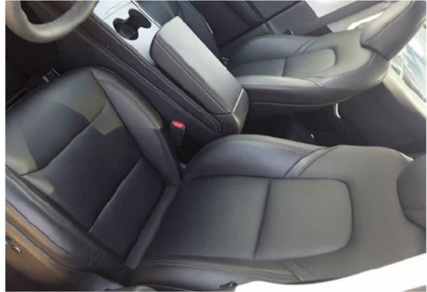
Abbildung 8: Innenraum vorne