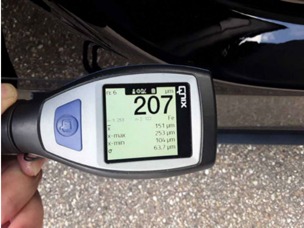
Nachlackierung 1: Heckklappe/-tür, Schweller rechts