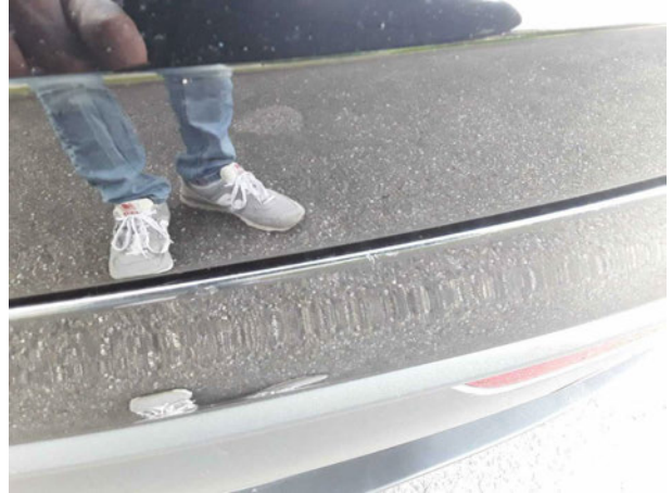
Beschädigung #1: Stossfänger hinten: Stossfänger hinten - verkratzt / verschürft - Smart Repair