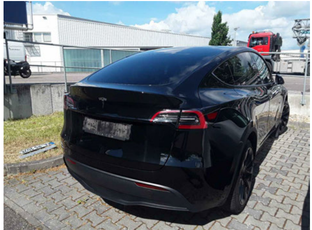
Abbildung 4: Schräg hinten