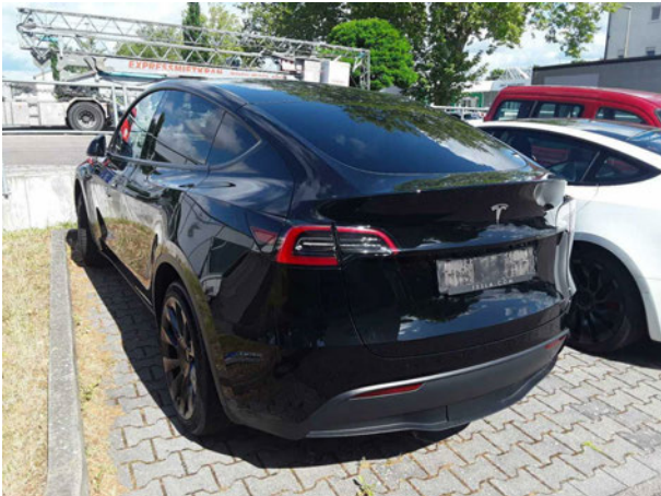
Abbildung 3: Schräg hinten