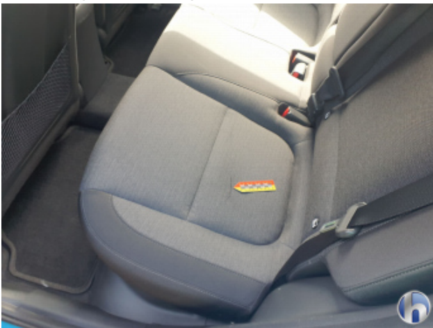
4. Sitz Innenraum links hinten Riss - Erneuern