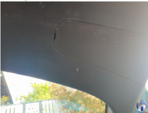
3. Verkleidung Gebrauchsspuren - Ohne Reparatur