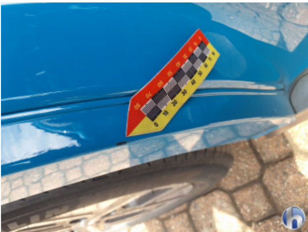
1. Seitenwand - Hinten - Rechts Kratzer - Smart Repair