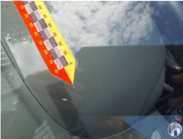
2. Windschutzscheibe Steinschlag - Smart Repair