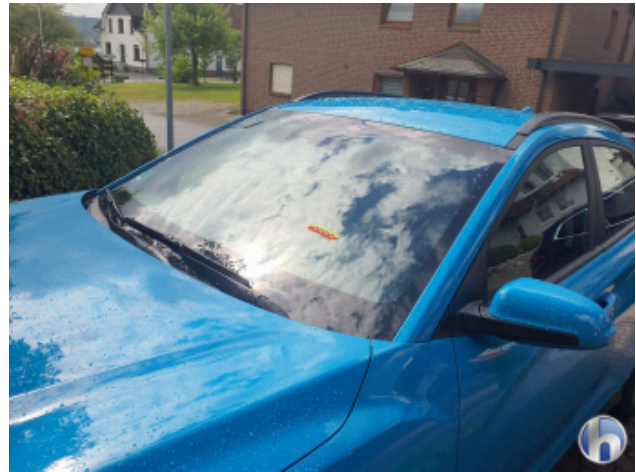
2. Windschutzscheibe Steinschlag - Smart Repair