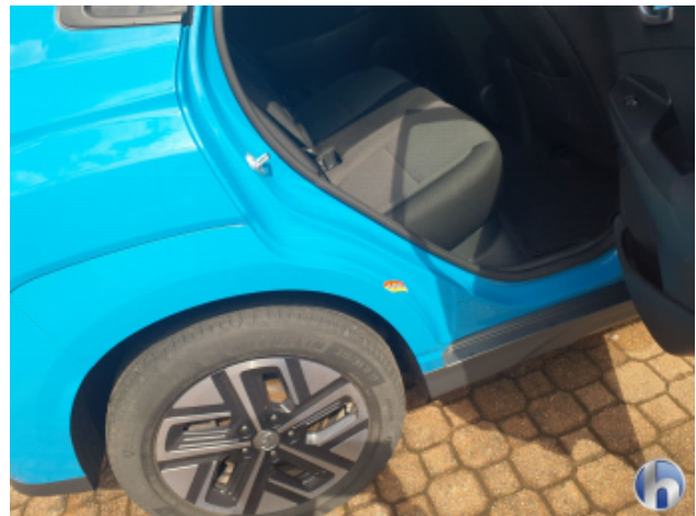
1. Seitenwand - Hinten - Rechts Kratzer - Smart Repair