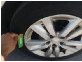
Golpe(s) y arañazo(s)