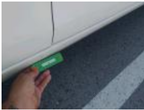
Aleta Tras Dr