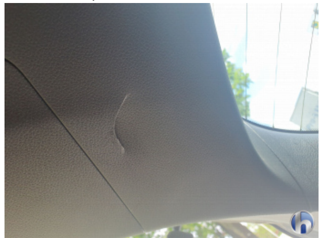
4. Heckdeckelverkleidung Kratzer - Erneuern