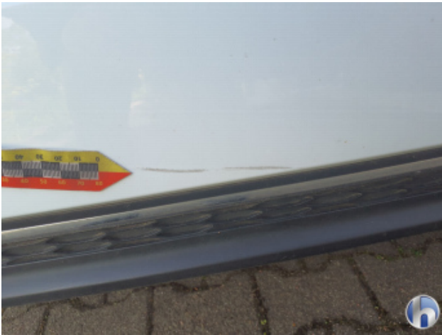
2. Stoßfänger Hinten Kratzer - Smart Repair