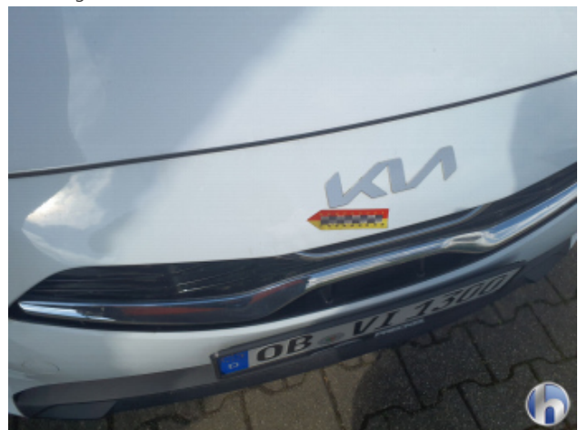
1. Motorhaube Steinschlag - Smart Repair