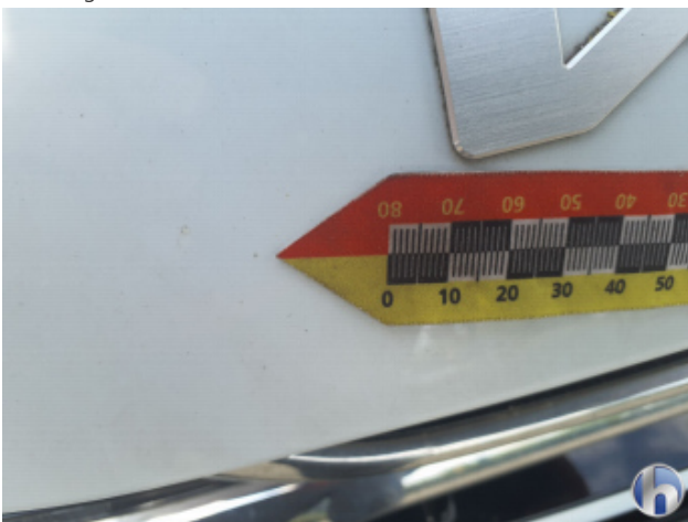
1. Motorhaube Steinschlag - Smart Repair