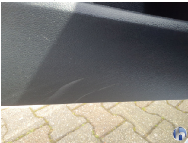
3. Verkleidung Kratzer - Smart Repair