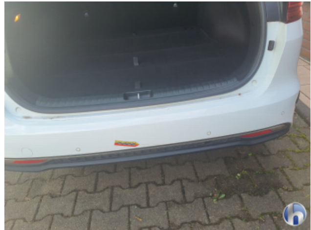
2. Stoßfänger Hinten Kratzer - Smart Repair