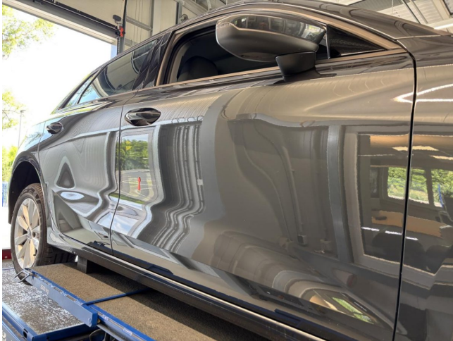
Tür vorne rechts - Delle - entfernen

Auftr.-Nr: nicht vorhanden VIN: WAUZZZGY6PA142870 Kilometerstand: 68.048 km Erstzulassung: 06.07.2023 Anzahl Halter lt. Kunde: 1 Anzahl Halter lt. Zulbesch. II: 1