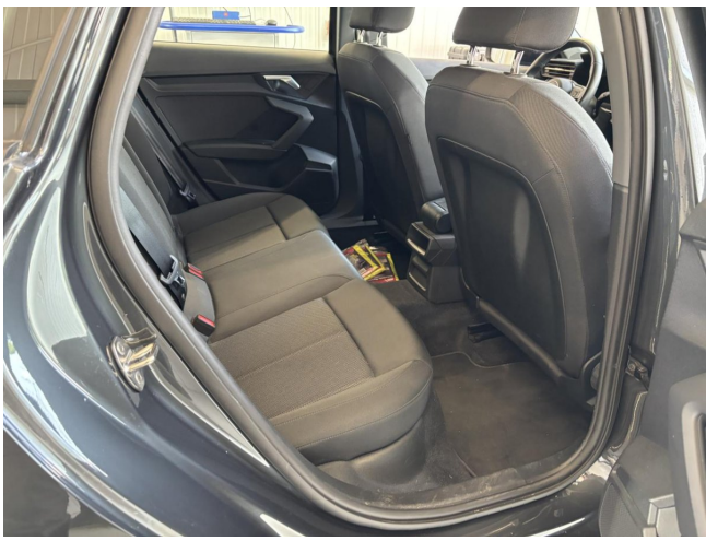
Innenraum hinten rechts