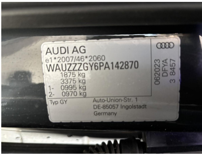
Typenschild mit VIN