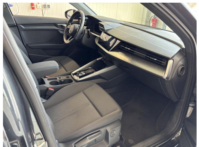
Innenraum vorne rechts