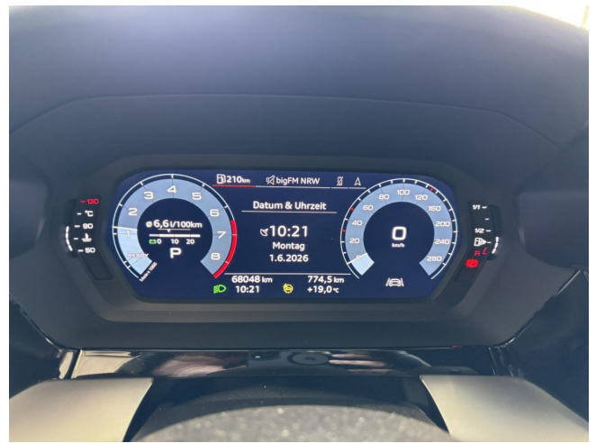
KM-Stand bei laufendem Motor (Ready)