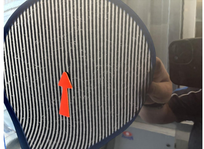
Tür vorne rechts - Delle - entfernen