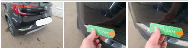
Moulure de pare-chocs ARG, Dégrafé, Acceptable