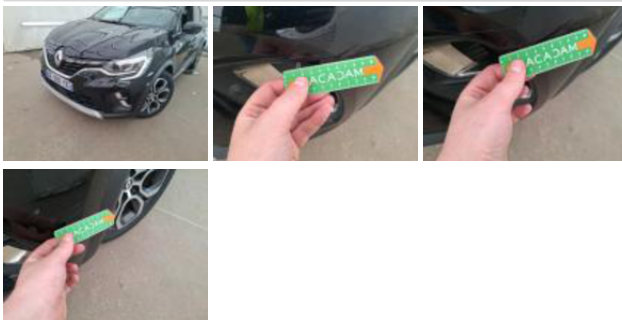
Coin pare-choc ARG, Griffe(s), Peindre