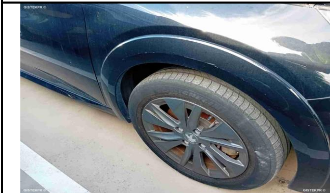
Foto daños externos 1