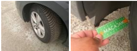
Protect. pass. roue AVD, Cassé, E - Remplacer