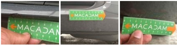
Porte AVD, Bosse(s), LI - Réparer et peindre (complet)