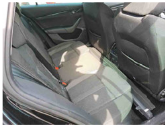
Innenraum - hinten