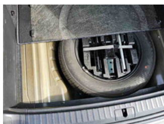
Räder - Ersatzrad