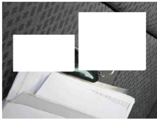
Equipment - Boardmappe/ Securitybag