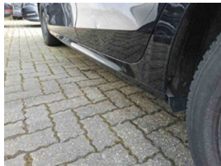
Seitenansicht - Schweller links