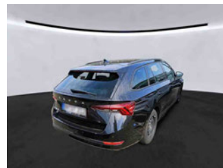
Fahrzeugansicht - diagonal hinten rechts