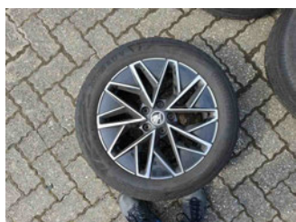
Räder - Rad montiert hinten rechts