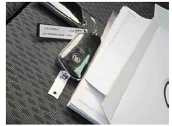
Fahrzeug - Serviceunterlagen / Wartungsnachweis