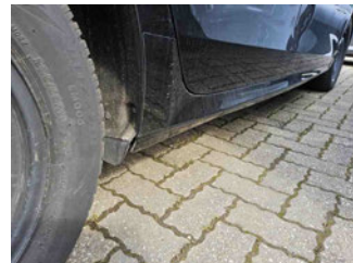
Seitenansicht - Schweller rechts