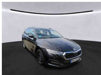
Fahrzeugansicht - diagonal vorne rechts