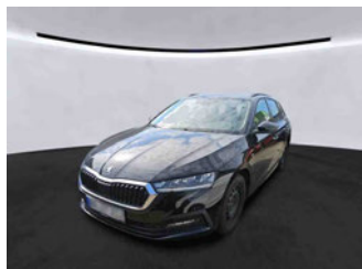
Fahrzeugansicht - diagonal vorne links