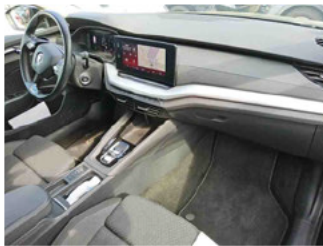
Innenraum - vorne