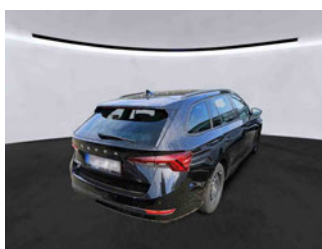
Fahrzeugansicht - diagonal hinten rechts