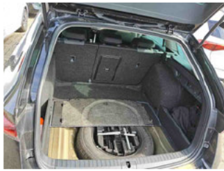
Innenraum - Kofferraum