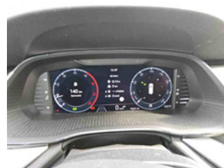
Innenraum - Cockpit mit Laufleistung