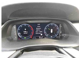
Innenraum - Cockpit mit Laufleistung