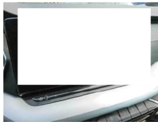
Innenraum - Navigationsgerät/Radio