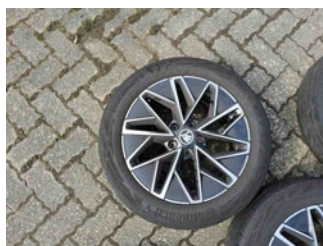
Räder - Rad montiert vorne rechts