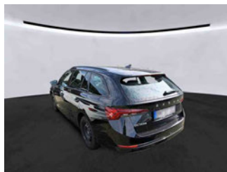
Fahrzeugansicht - diagonal hinten links