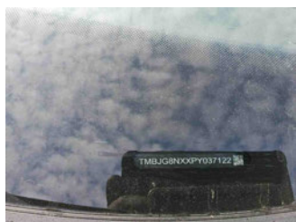
Fahrzeug - Typenschild/Fahrgestellnummer