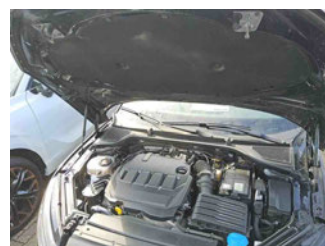
Fahrzeug - Motorraum offen