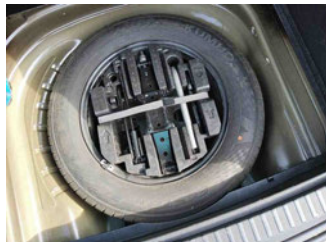
Equipment - Bordwerkzeug