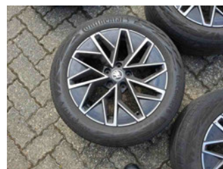
Räder - Rad montiert hinten links