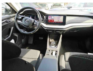
Innenraum - Mittelkonsole