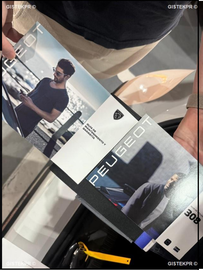
guías uso y mantenimiento