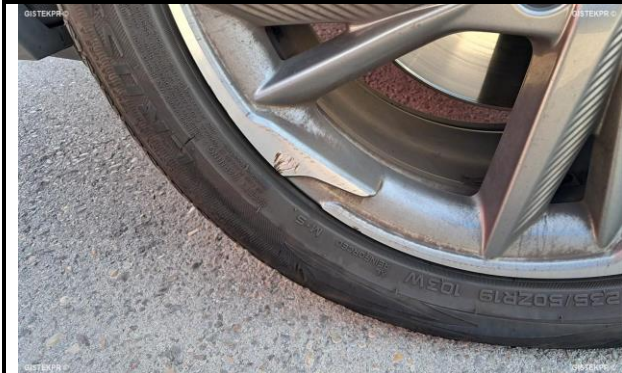
Foto daños externos 1