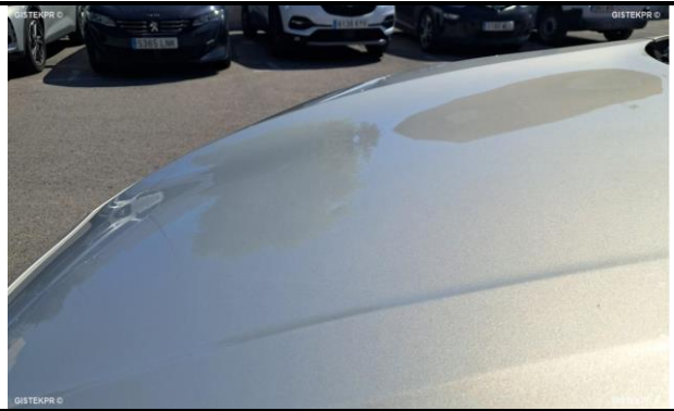
Foto daños externos 1