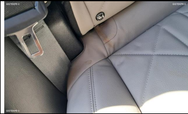
Foto daños internos 48