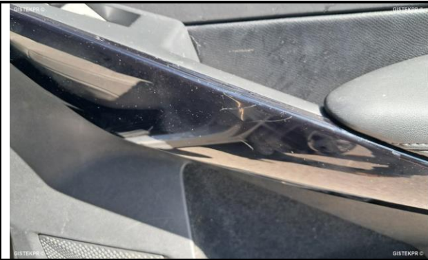
Foto daños internos 48