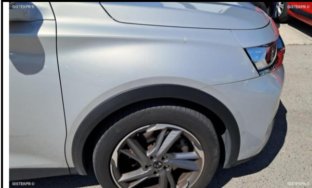
Foto daños externos 1