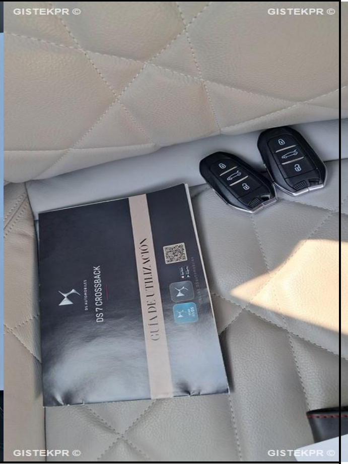
Foto documentación 1