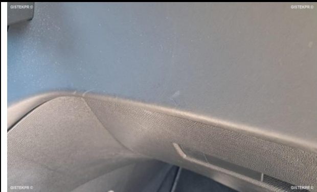
Foto daños internos 48