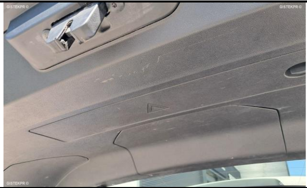
Foto daños internos 48