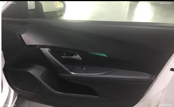
FLTD_FOTOS LATERAL DERECHA