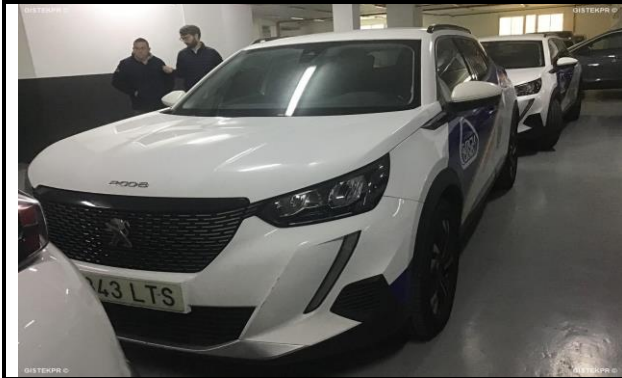
FFLTl FOTOS FRONTO LATERAL IZQUIERDA

INFORME-STELL-RE-1279- 2025__(9514241241-8343LTS).DOC