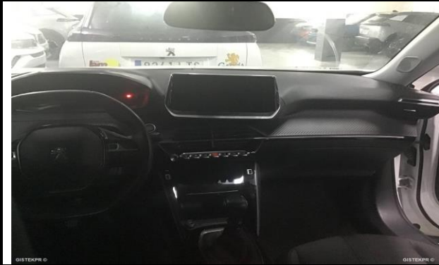
FSALP FOTOS SALPICADERO