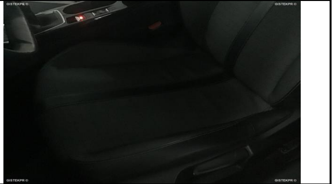
FASDEL FOTOS ASIENTOS DELANTEROS