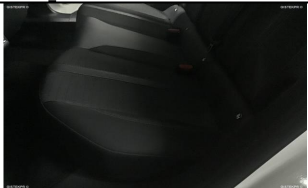
FASTRAS_FOTOS ASIENTOS TRASEROS