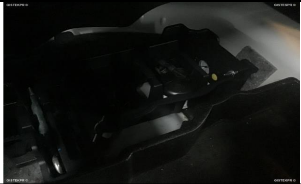
FTRAS FOTOS TRASERA