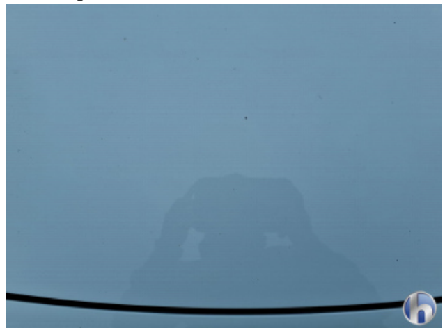
5. Motorhaube Steinschlag - Lackieren