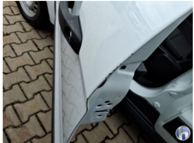
3. Tür Vorne - Links Beschädigt - Smart Repair