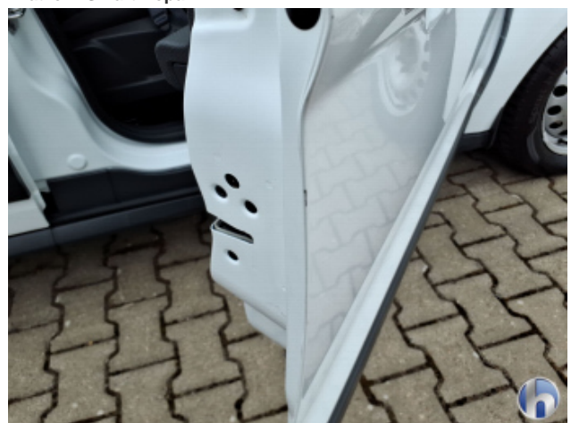
2. Tür Vorne - Rechts Gebrauchsspuren - Ohne Reparatur