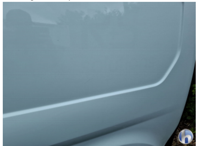
4. Seitenwand - Hinten - Links Kratzer - Smart Repair