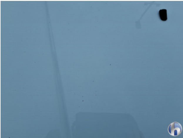
5. Motorhaube Steinschlag - Lackieren