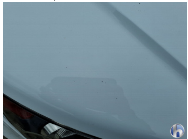
5. Motorhaube Steinschlag - Lackieren