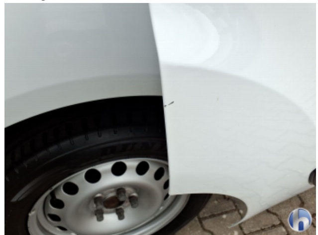
1. Tür Hinten - Rechts Kratzer - Smart Repair