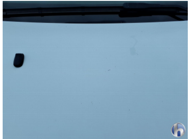
5. Motorhaube Steinschlag - Lackieren