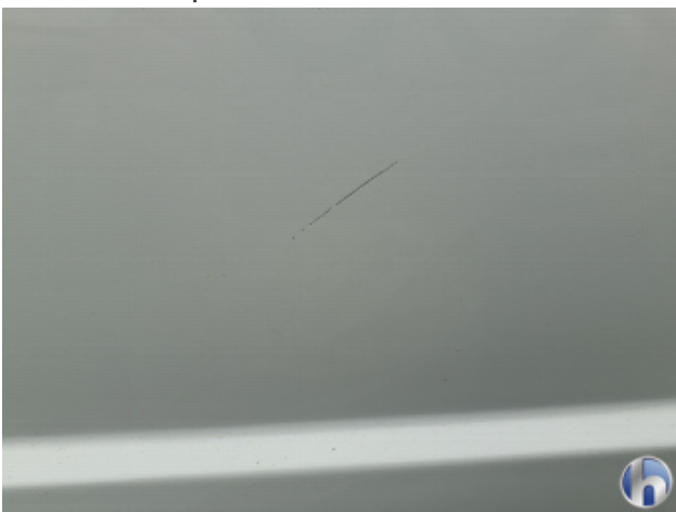
4. Seitenwand - Hinten - Links Kratzer - Smart Repair