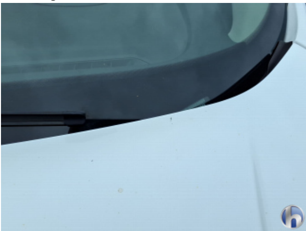
5. Motorhaube Steinschlag - Lackieren