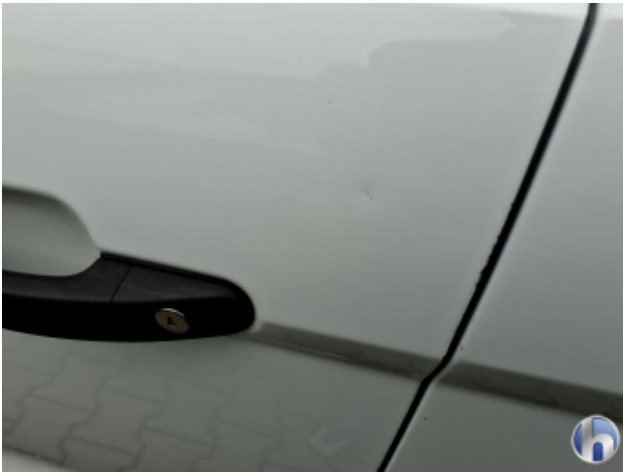
3. Tür Vorne - Links Beschädigt - Smart Repair