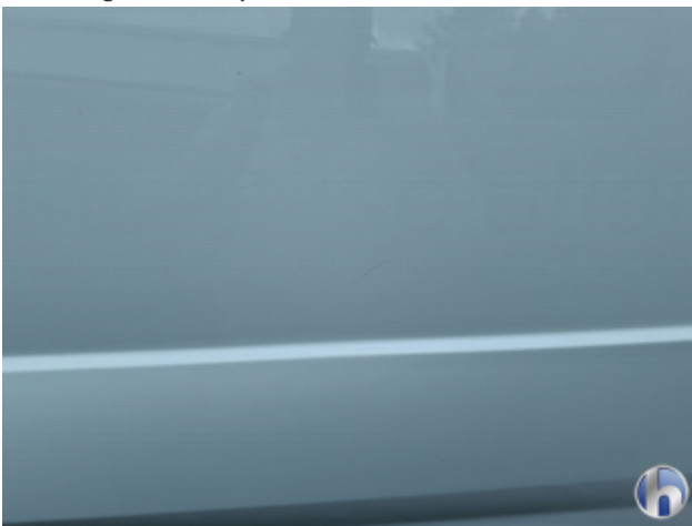
4. Seitenwand - Hinten - Links Kratzer - Smart Repair