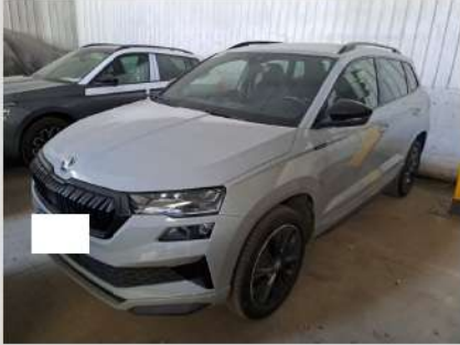
Anteriore sinistra 3/4