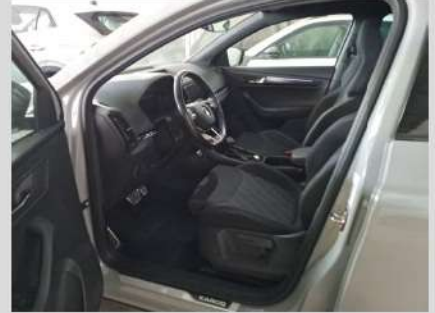
Interni lato guida