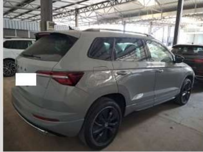
Posteriore destra 3/4