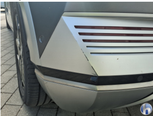
1. Stoßfänger Hinten Kratzer - Lackieren