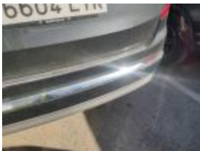
Moldura Parachoques Tras