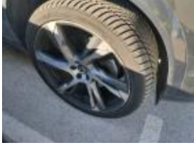
Kit reparación Neumático