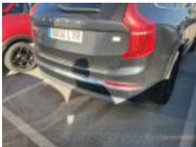
Moldura Parachoques Tras Dr