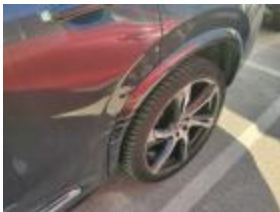
Llanta aluminioTras Iz Bicolor/policroma