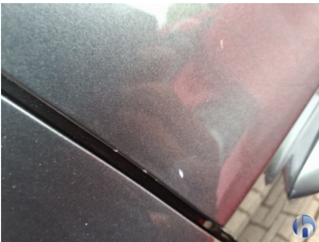
1. Tür Vorne - Rechts Kratzer - Smart Repair