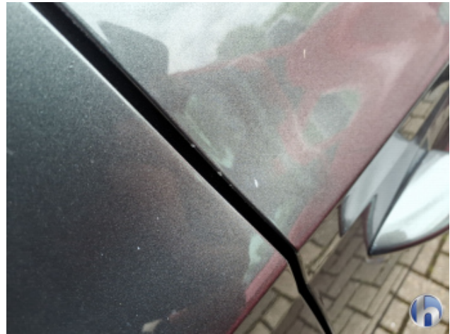
1. Tür Vorne - Rechts Kratzer - Smart Repair