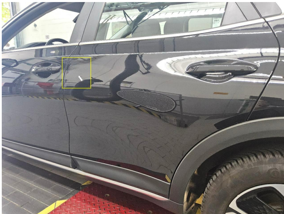
Bild 7 : Tür hinten links Lackierung, zerkratzt, lackieren mit Lackaufbau