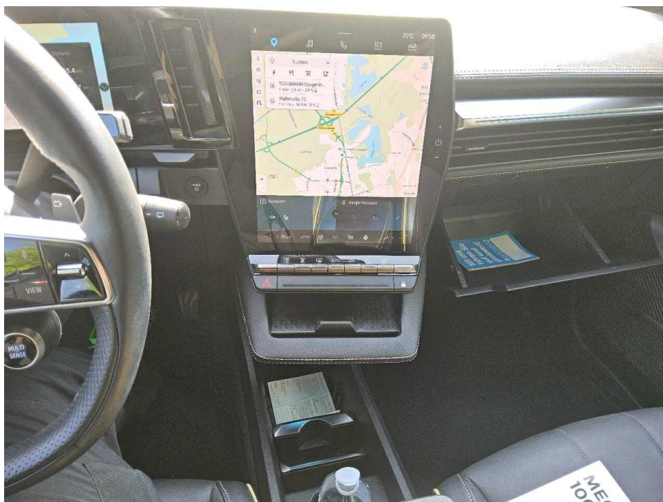
Bild 7 : Mittelkonsole des Rücksitzes (Radio/Navigation eingeschaltet)