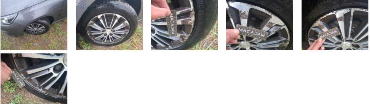
71095036 Jante alum. ARG bi-ton/polychrome Griffe(s) E - Remplacer