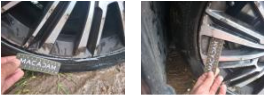
71095035 Jante alum. AVG bi-ton/polychrome Griffe(s) E - Remplacer