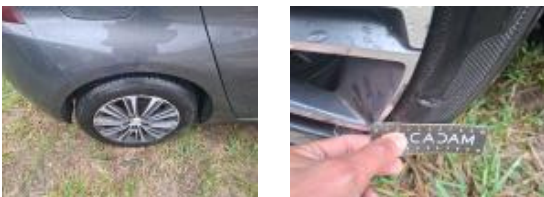
71095040 Pneu AVD Déchirure E - Remplacer