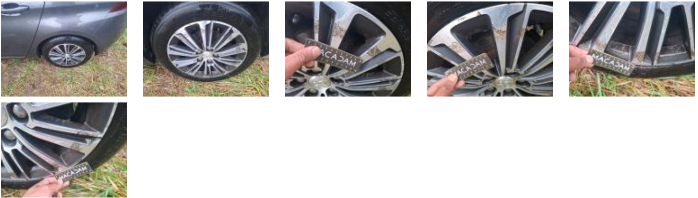
71095038 Pneu ARD Déchirure E - Remplacer