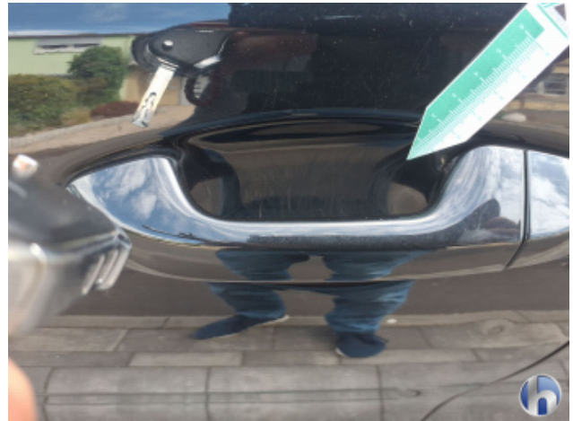
2. Tür Vorne - Links Kratzer - Smart Repair