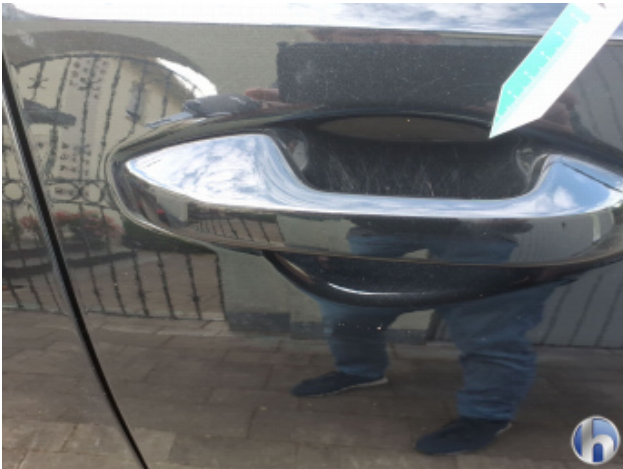
1. Tür Vorne - Rechts Kratzer - Smart Repair