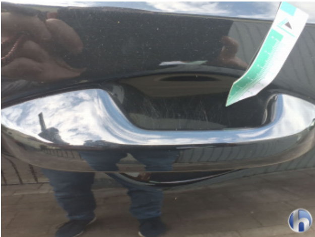
2. Tür Vorne - Links Kratzer - Smart Repair