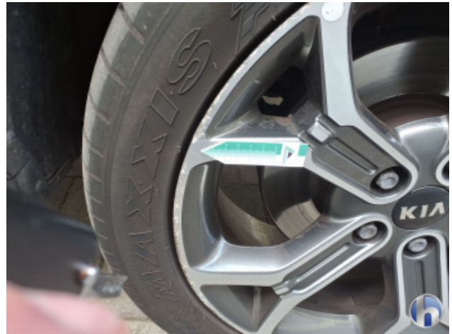
3. Felge Vorne - Rechts Kratzer - Smart Repair