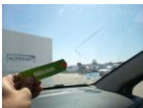
Necesario para instalar el acristalamiento