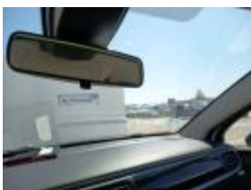
Kit de pegamento de parabrisas