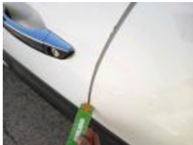
Golpe(s) y arañazo(s)