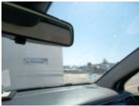
Faro Del Dr