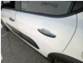
Puerta Delant Iz