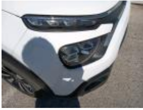
Aleta Del Dr