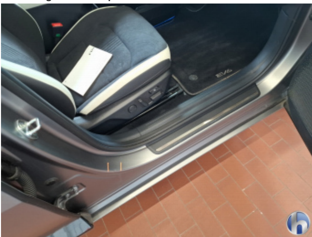
3. Türeinstieg Vorne - Rechts 1 Delle - Smart Repair