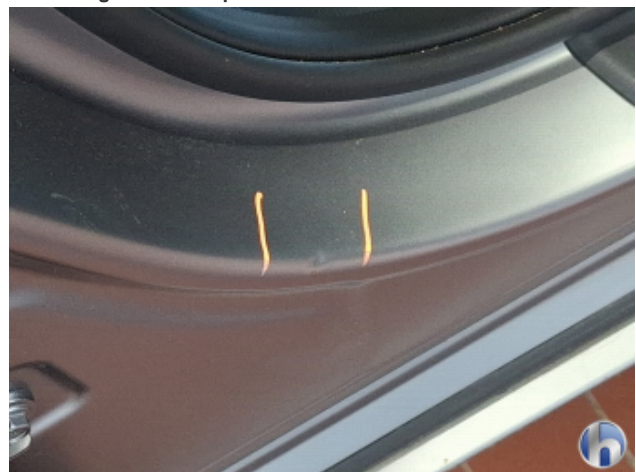
3. Türeinstieg Vorne - Rechts 1 Delle - Smart Repair