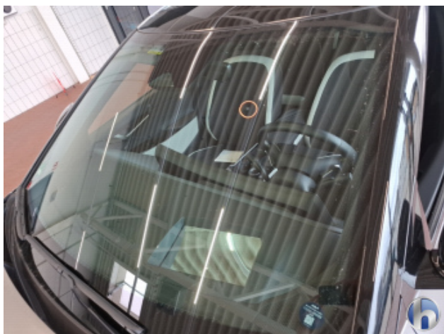
4. Windschutzscheibe Gebrauchsspuren - Ohne Reparatur