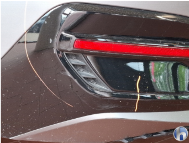
1. Stoßfänger Hinten Abschürfung - Smart Repair