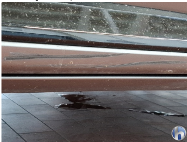
5. Schweller - Rechts Abschürfung - Smart Repair