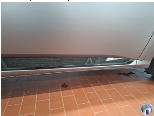
5. Schweller - Rechts Abschürfung - Smart Repair