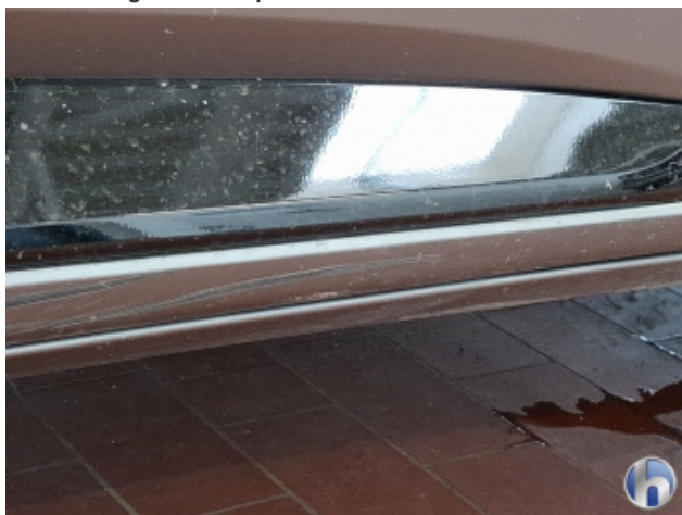
5. Schweller - Rechts Abschürfung - Smart Repair