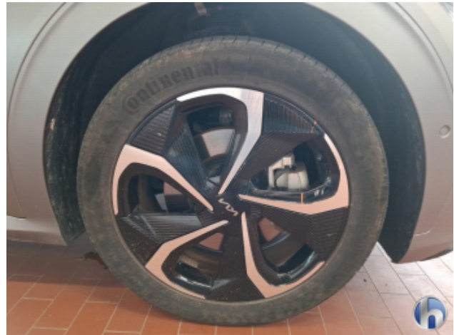
2. Felge Vorne - Rechts Beschädigt - Smart Repair