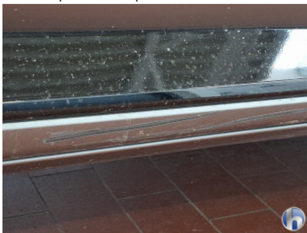
5. Schweller - Rechts Abschürfung - Smart Repair