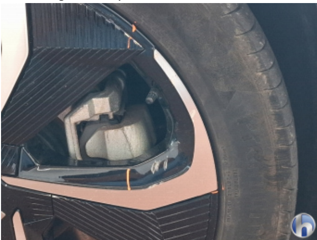
2. Felge Vorne - Rechts Beschädigt - Smart Repair