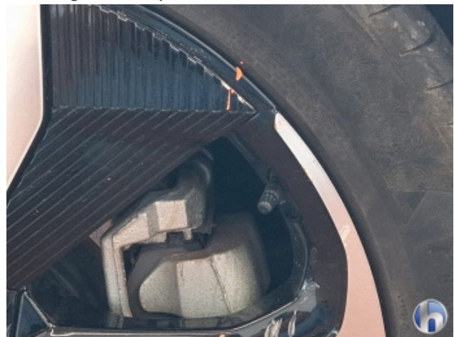
2. Felge Vorne - Rechts Beschädigt - Smart Repair