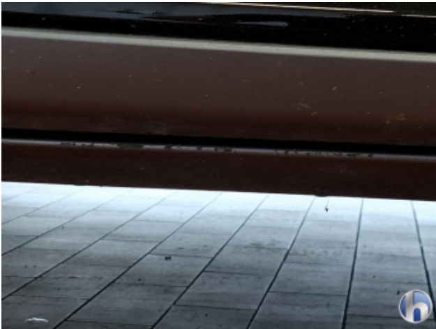
5. Schweller - Rechts Abschürfung - Smart Repair