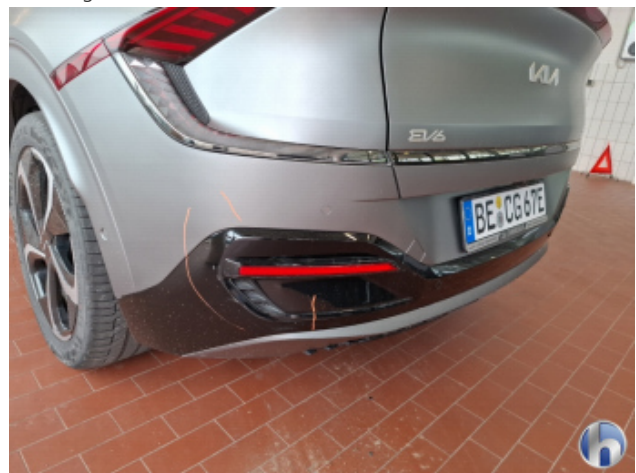
1. Stoßfänger Hinten Abschürfung - Smart Repair