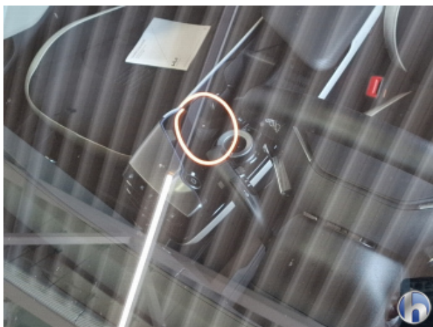
4. Windschutzscheibe Gebrauchsspuren - Ohne Reparatur