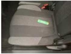
Revêtement assise siège AVG, Tache, Nettoyer