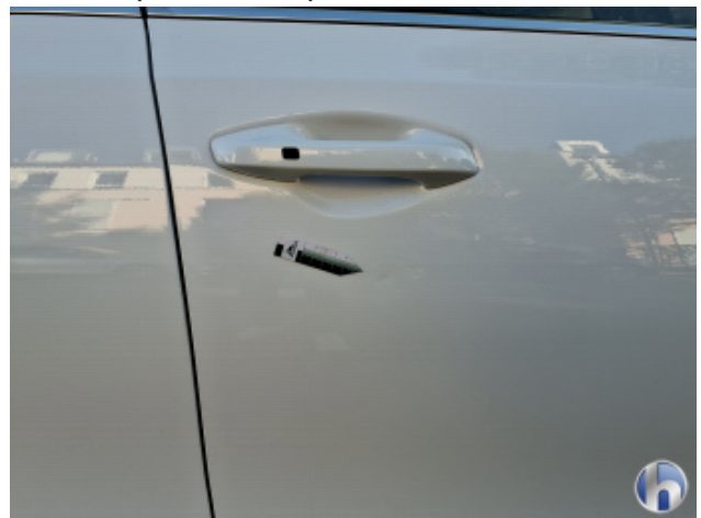
3. Tür Vorne - Rechts Verdellt - Instandsetzen und Lackieren