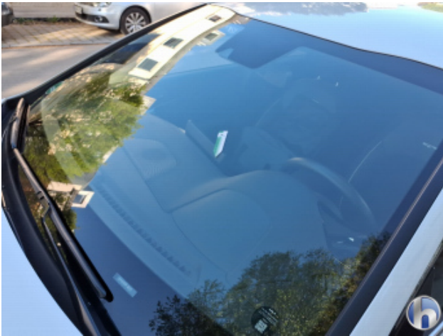
2. Windschutzscheibe Gebrauchsspuren - Ohne Reparatur