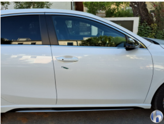
3. Tür Vorne - Rechts Verdellt - Instandsetzen und Lackieren