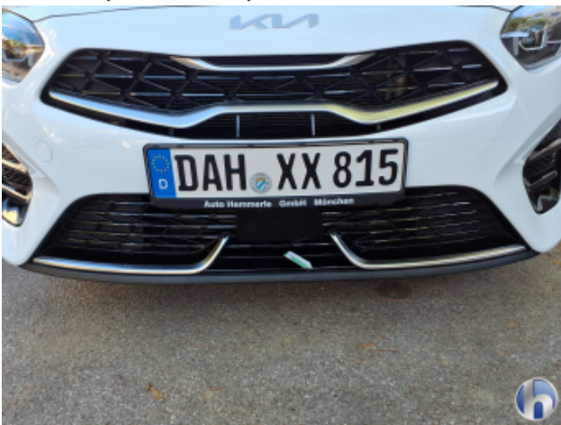
6. Stoßfänger Vorne Gebrauchsspuren - Ohne Reparatur