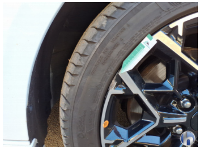
4. Felge Vorne - Rechts Beschädigt - Smart Repair