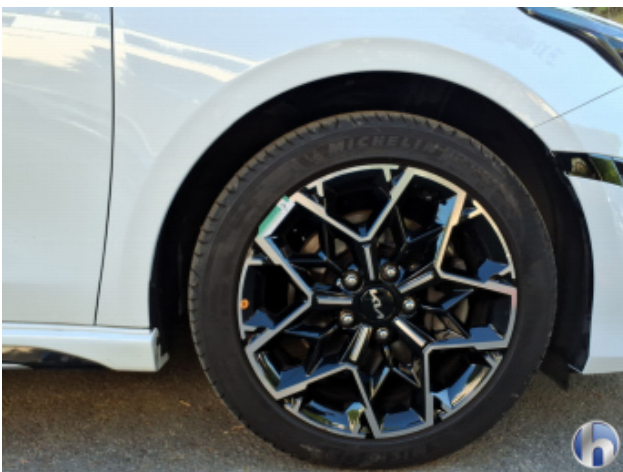
4. Felge Vorne - Rechts Beschädigt - Smart Repair