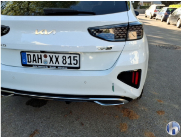
5. Stoßfänger Hinten Gebrauchsspuren - Ohne Reparatur