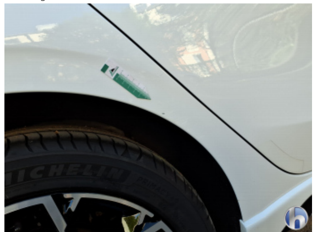
1. Seitenwand - Hinten - Rechts Unsachgemäß Instandgesetzt - Instandsetzen und Lackieren