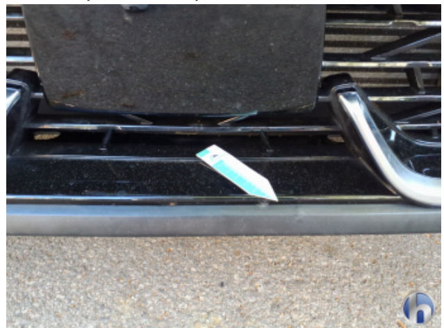
6. Stoßfänger Vorne Gebrauchsspuren - Ohne Reparatur