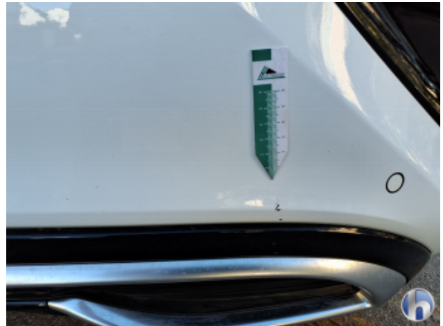
5. Stoßfänger Hinten Gebrauchsspuren - Ohne Reparatur