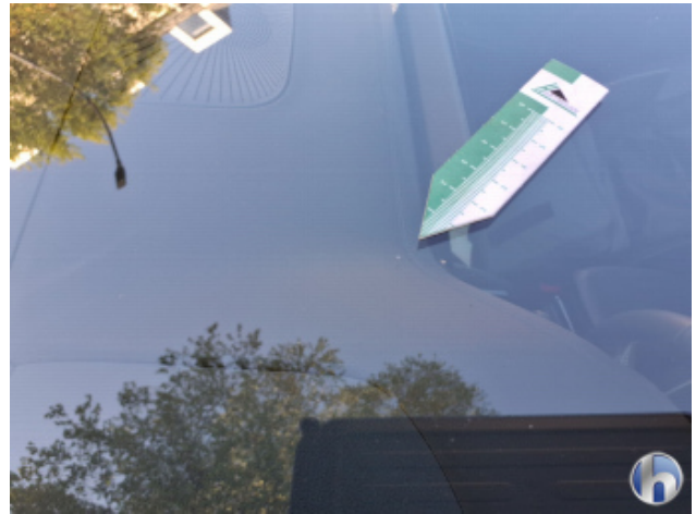
2. Windschutzscheibe Gebrauchsspuren - Ohne Reparatur