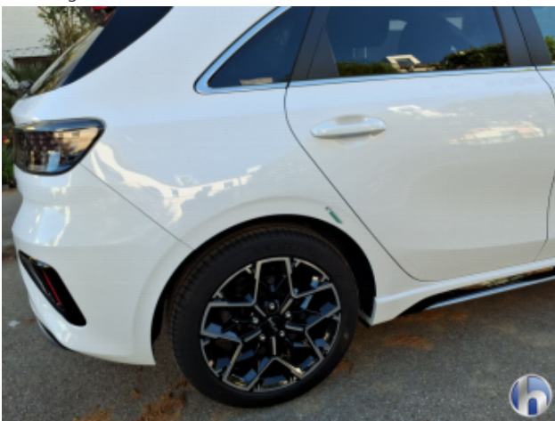
1. Seitenwand - Hinten - Rechts Unsachgemäß Instandgesetzt - Instandsetzen und Lackieren