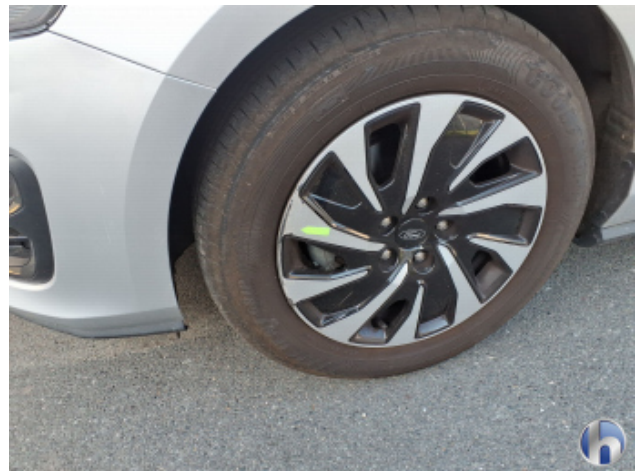
1. Felge Vorne - Links Kratzer - Smart Repair