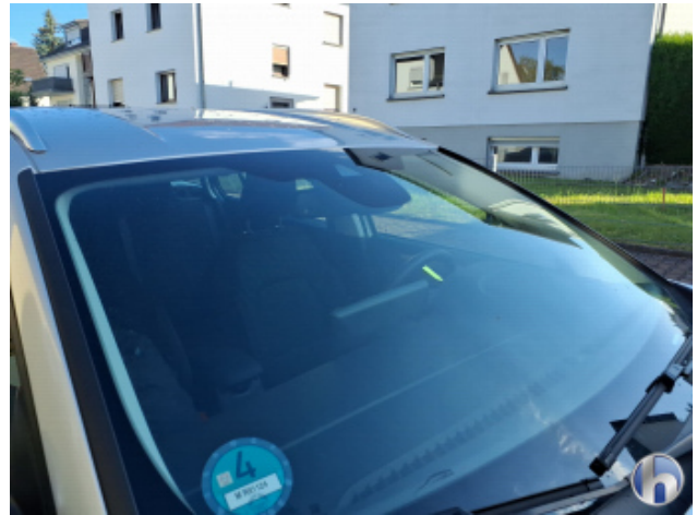
2. Windschutzscheibe Gebrauchsspuren - Ohne Reparatur