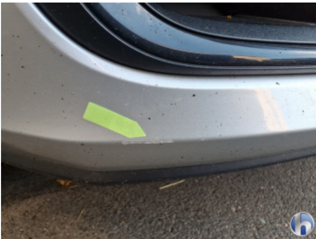
3. Stoßfänger Vorne Kratzer - Lackieren