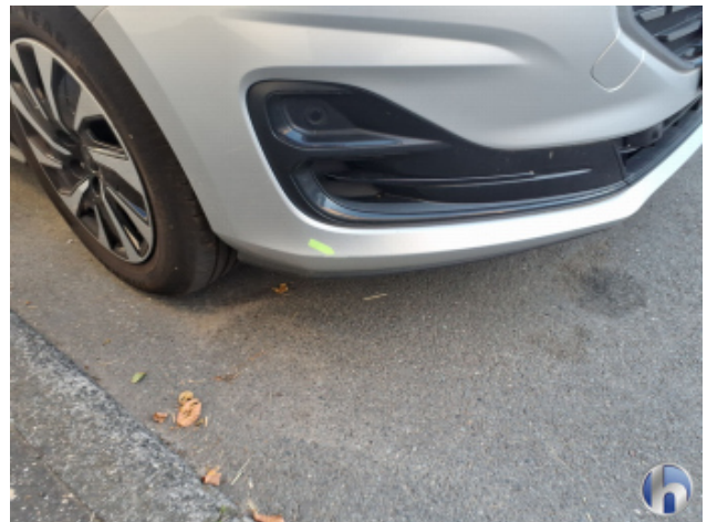
3. Stoßfänger Vorne Kratzer - Lackieren