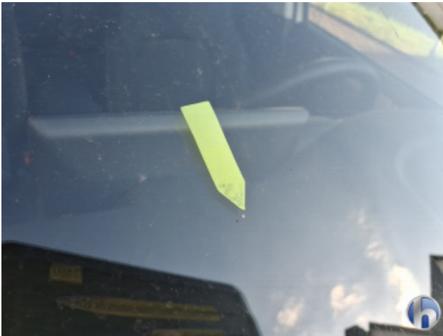
2. Windschutzscheibe Gebrauchsspuren - Ohne Reparatur