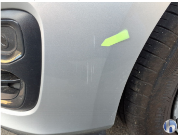
3. Stoßfänger Vorne Kratzer - Lackieren