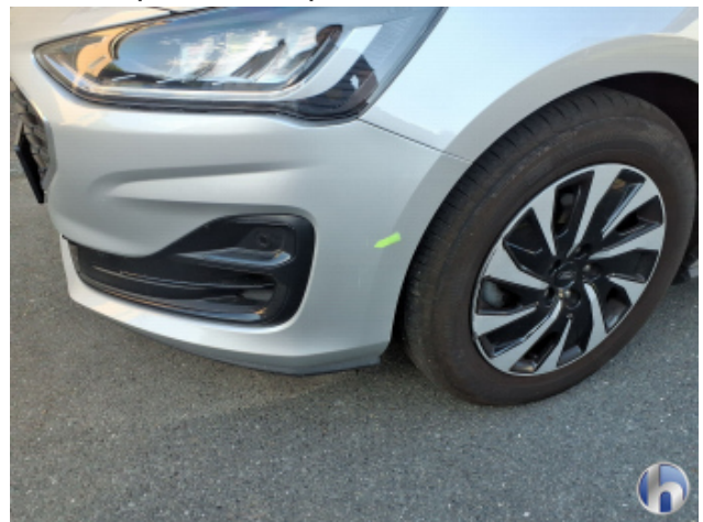
3. Stoßfänger Vorne Kratzer - Lackieren