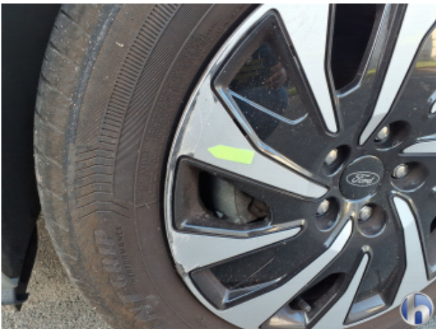
1. Felge Vorne - Links Kratzer - Smart Repair