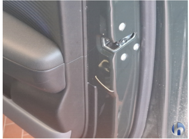
1. Türeinstieg Vorne - Rechts Beschädigt - Smart Repair