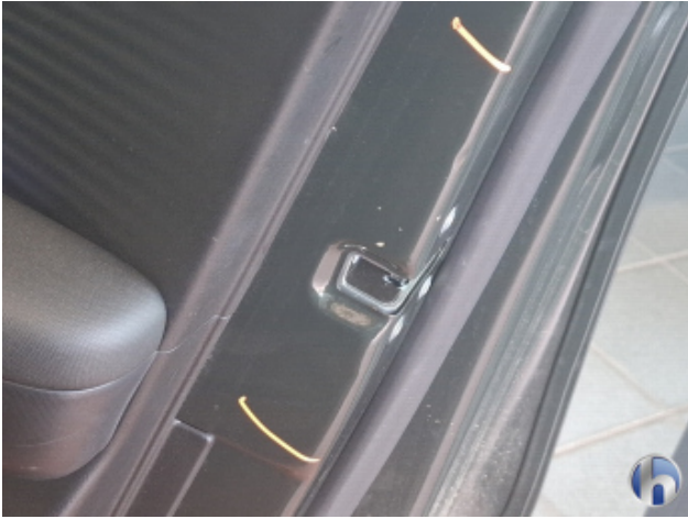
1. Türeinstieg Vorne - Rechts Beschädigt - Smart Repair