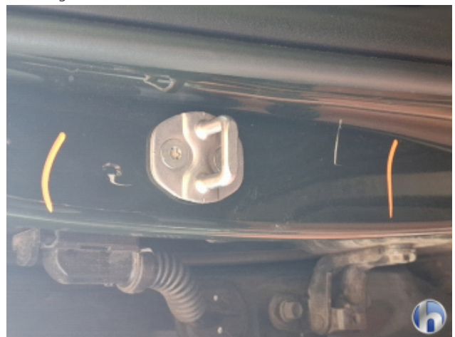
1. Türeinstieg Vorne - Rechts Beschädigt - Smart Repair