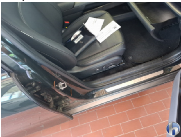
1. Türeinstieg Vorne - Rechts Beschädigt - Smart Repair