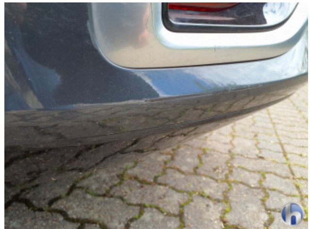
1. Stoßfänger Hinten Kratzer - Lackieren