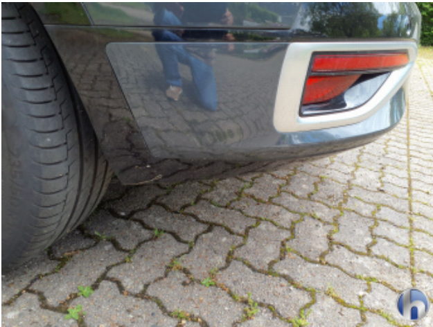
1. Stoßfänger Hinten Kratzer - Lackieren