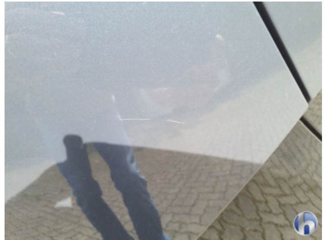
1. Stoßfänger Hinten Kratzer - Lackieren