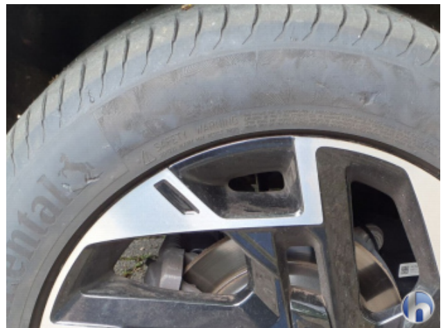
2. Reifen Hinten - Rechts Beschädigt - Erneuern