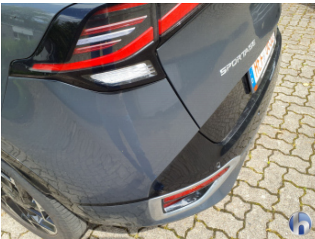
1. Stoßfänger Hinten Kratzer - Lackieren